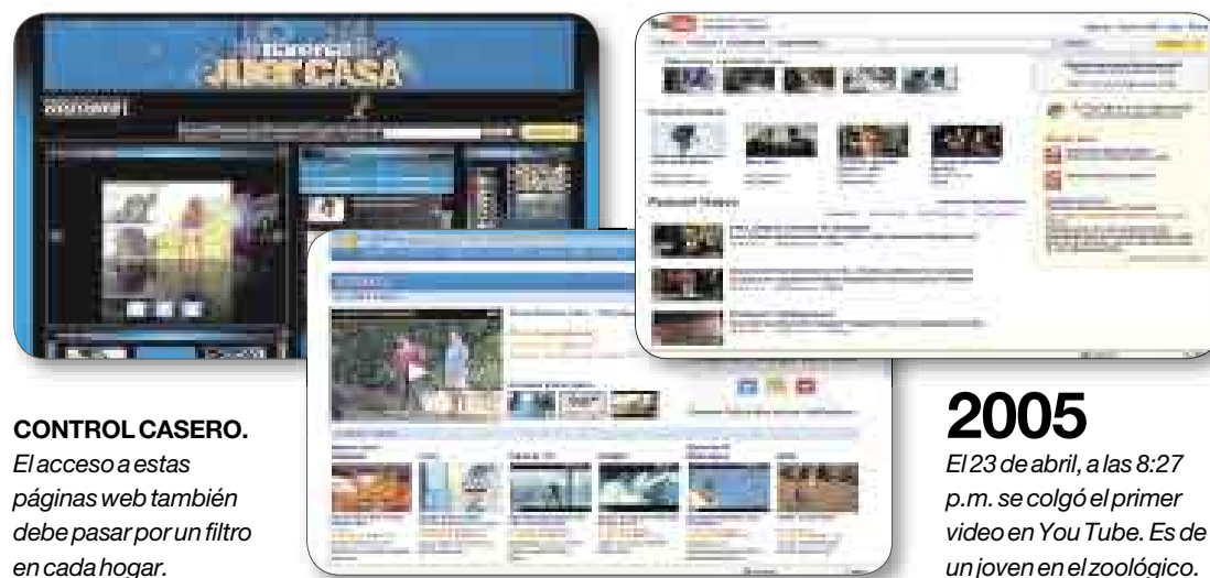
CONTROL CASERO. El acceso a estas páginas web también debe pasar por un filtro en cada hogar.

Sin embargo, cada uno maneja términos de uso y condiciones distintas, particularmente en lo que se refiere al material con contenido sexual o inapropiado.