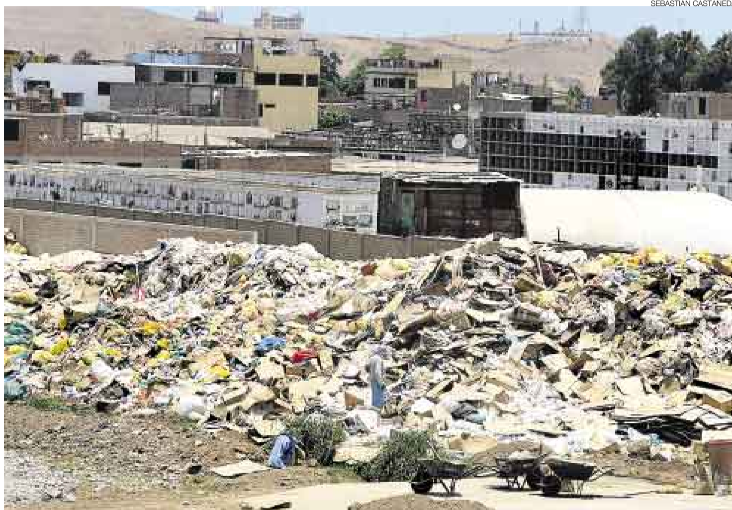
INDESEABLE. Los desechos han atraído moscas y mal olor, según vecinos de la urbanización Las Hiedras.

“Hemos estado acumulando y dando el tratamiento que sea