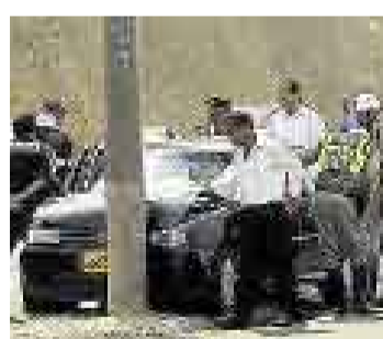
CONFUSIÓN POR SEÑALES.