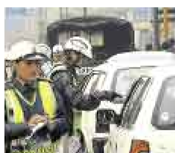
SIN REGISTRO DE MULTAS.

1 El Ministerio de Transportes y Comunicaciones tiene la facultad de suspender licencias de conducir y hasta inhabilitar de por vida a un chofer que ha acumulado un determinado número de infracciones, sin embargo lo hace mínimamente porque no cuenta con un registro de infractores, como lo ordena la ley desde el 2001.