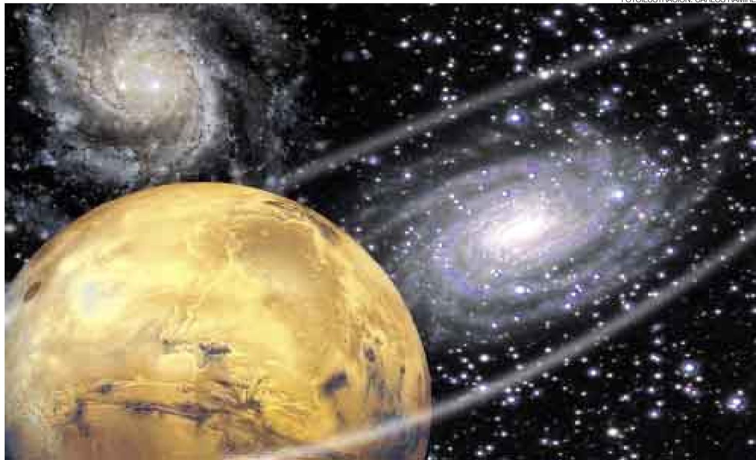
FOTOLUSTRACIÓN: CARLOS RAMÍREZ

Con la nueva escala nuestra galaxia, la Vía Láctea, resultó tener unos 100 mil años luz de diámetro, con el centro a 27.000 años luz del Sol. Las Nubes Magallánicas, nuestras galaxias satélites, resultaron estar a 155 y 165 mil años luz. Nuestro Sistema Solar, en los suburbios de la galaxia, está a 2/3 del centro*. Aún formábamos parte de un Universo cerrado y finito, la Vía Láctea y sus galaxias satélites; idea que tampoco duraría.