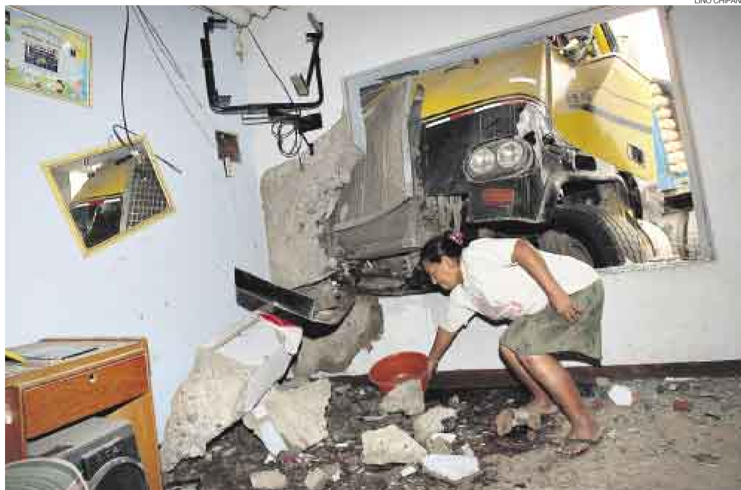
PUDO SER PEOR. El tráiler por poco entra en la sala. La gasolina se derramó sobre el piso. Las paredes sufrieron rajaduras por el impacto.

Camión se empotró en casa y familia salvó de milagro