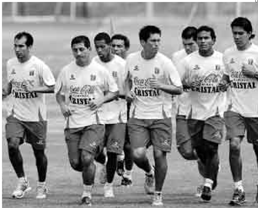
OPCIÓN. A falta de estrellas, Chemo optará por un equipo que se entregue en el campo.

La selección tiene a nueve jugadores en capilla