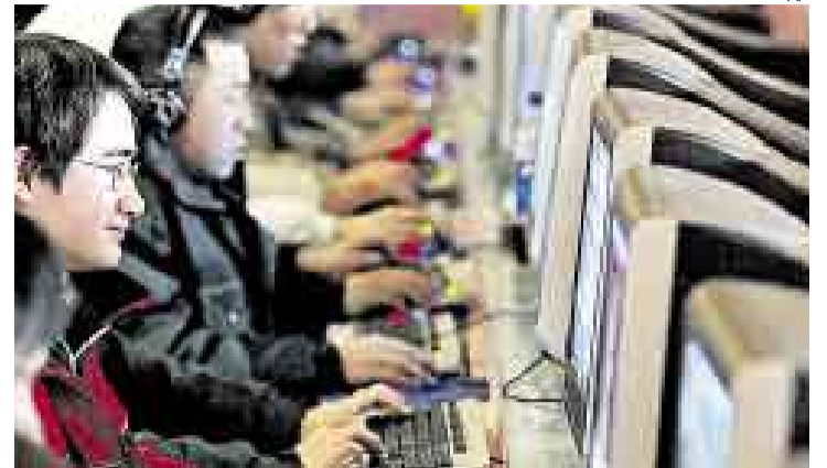
SIN CONEXIÓN. Además de dejar de usar Internet por unos días, se propone no comer carne o cortar la calefacción.