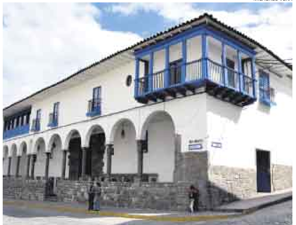
Primera edición. Izq., carátula de “Los comentarios reales”, 1609. Der.: Casa de Garcilaso en Cusco.