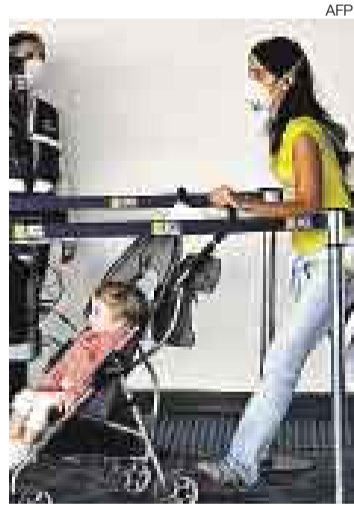
CONTROL. Los pasajeros pasan por escáneres térmicos en Chile.

Así lo indicó el Consulado General del Perú, tras comunicarse