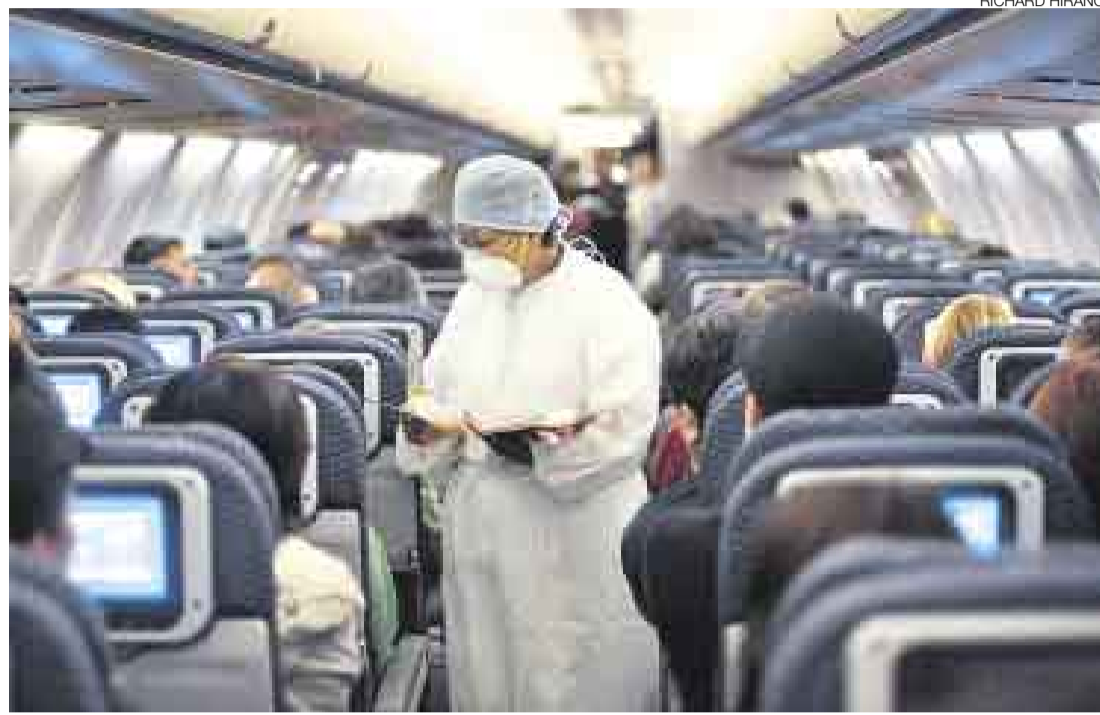
A BORDO. El control y la evaluación a los pasajeros se hace en los aviones antes de que desembarquen.

CINCO CASOS DESCARTADOS El ministro Ugarte aseguró por la