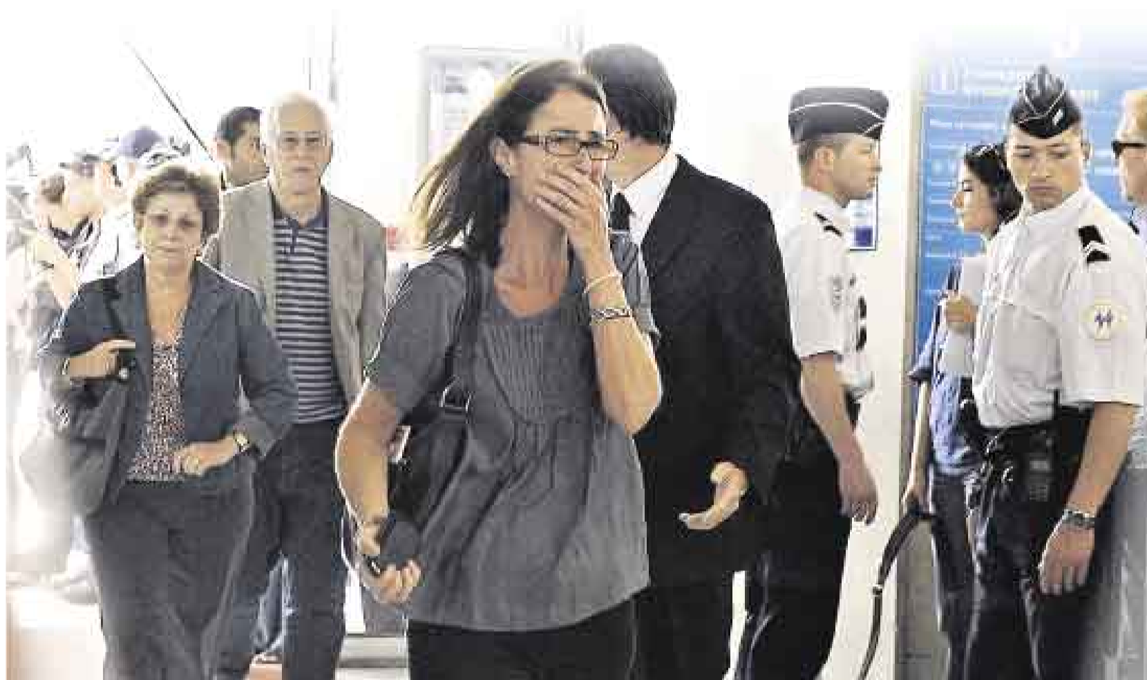
ANGUSTIA. Familiares y amigos de los pasajeros del vuelo Air France AF 447 llegan al aeropuerto Charles de Gaulle, cerca de París, en busca de información.