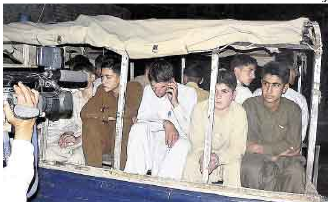
ESCAPARON. Unos 67 estudiantes lograron evadir la interceptación de los talibanes y avisaron a la policía.