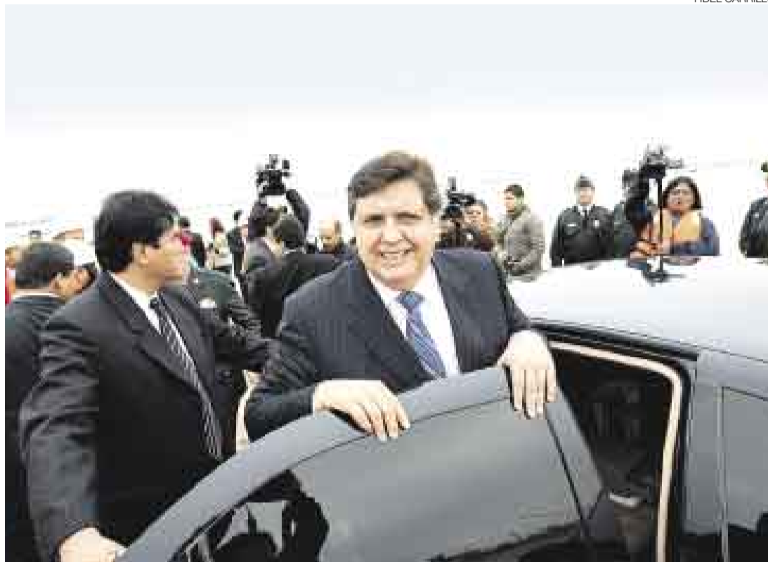
POSTURA. García advierte: “En adelante diálogo rápido y acción inmediata” para desbloquear vías.

“La policía está notificada de quién tiene al frente y tiene que actuar con energía”.