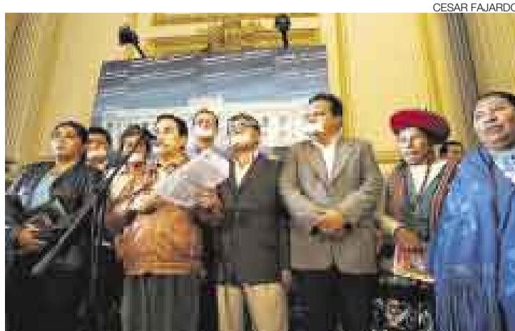
PROTESTAN. Los humalistas continúan con sus reclamos.