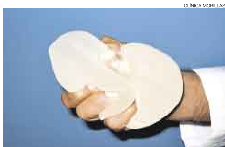
NOVEDAD. Las prótesis bilobuladas son más flexibles, tienen mayor duración y por su técnica de colocación no causan dolor en los pacientes.

inventé la prótesis bilobulada [con dos separaciones] que se coloca debajo del músculo grueso del glúteo para evitar que se vea o se ensanche por algún motivo", señaló.