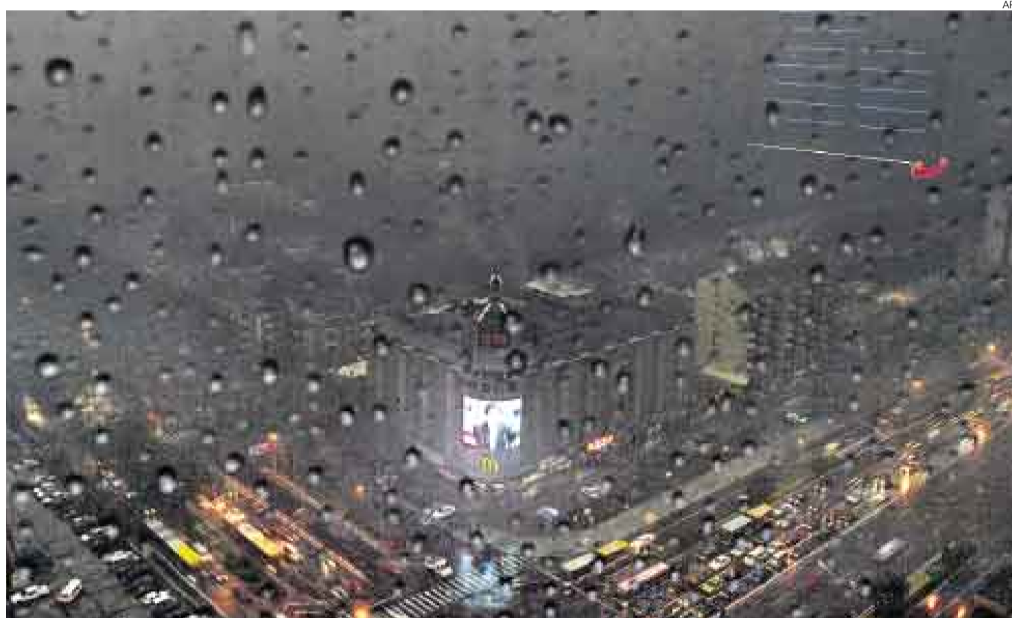
IMPRESIONANTE. Según los relojes, como el que apenas se ve en la foto, en Beijing faltaban 26 minutos para el mediodía, pero parecía la medianoche.

Las autoridades encendieron de inmediato el alumbrado de todas las calles cuando la capital quedó en tinieblas. El Ministerio de Transporte Público puso 200 autobuses de emergencia a disposición de los transeúntes. La policía y los bomberos se mantuvieron en estado de alerta, ya que la poca visibilidad y las lluvias prolongadas suelen originar accidentes de tránsito.