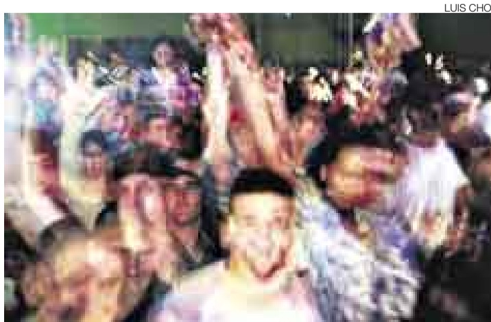
OJO. Muchas de las drogas sintéticas se consumen en fiestas electrónicas.