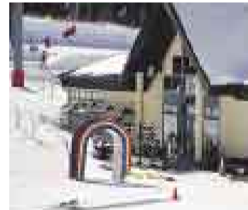
CLICS QUE VALEN. Iniciativa de USE premia el talento joven.

La cita –en la que se conocerá a los ganadores y se exhibirá el total de trabajos– es este jueves 25 de junio a las 7 de la noche en el local del Centro de la Imagen, ubicado en la avenida 28 de Julio 815, Miraflores. La entrada es gratuita. Apúntense.