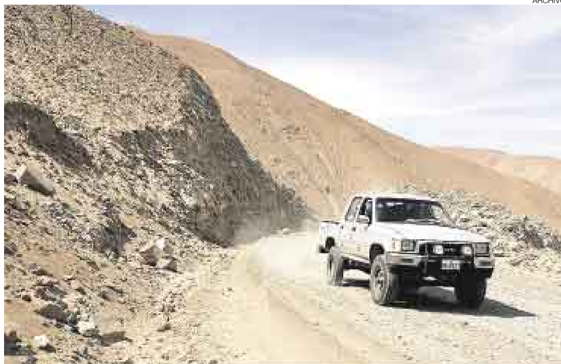
CAMINO RURAL. La creación de infraestructura acerca físicamente a las personas y tiende a integrarlas.

Con ello, se podría incluir a la población que vive a lo ancho