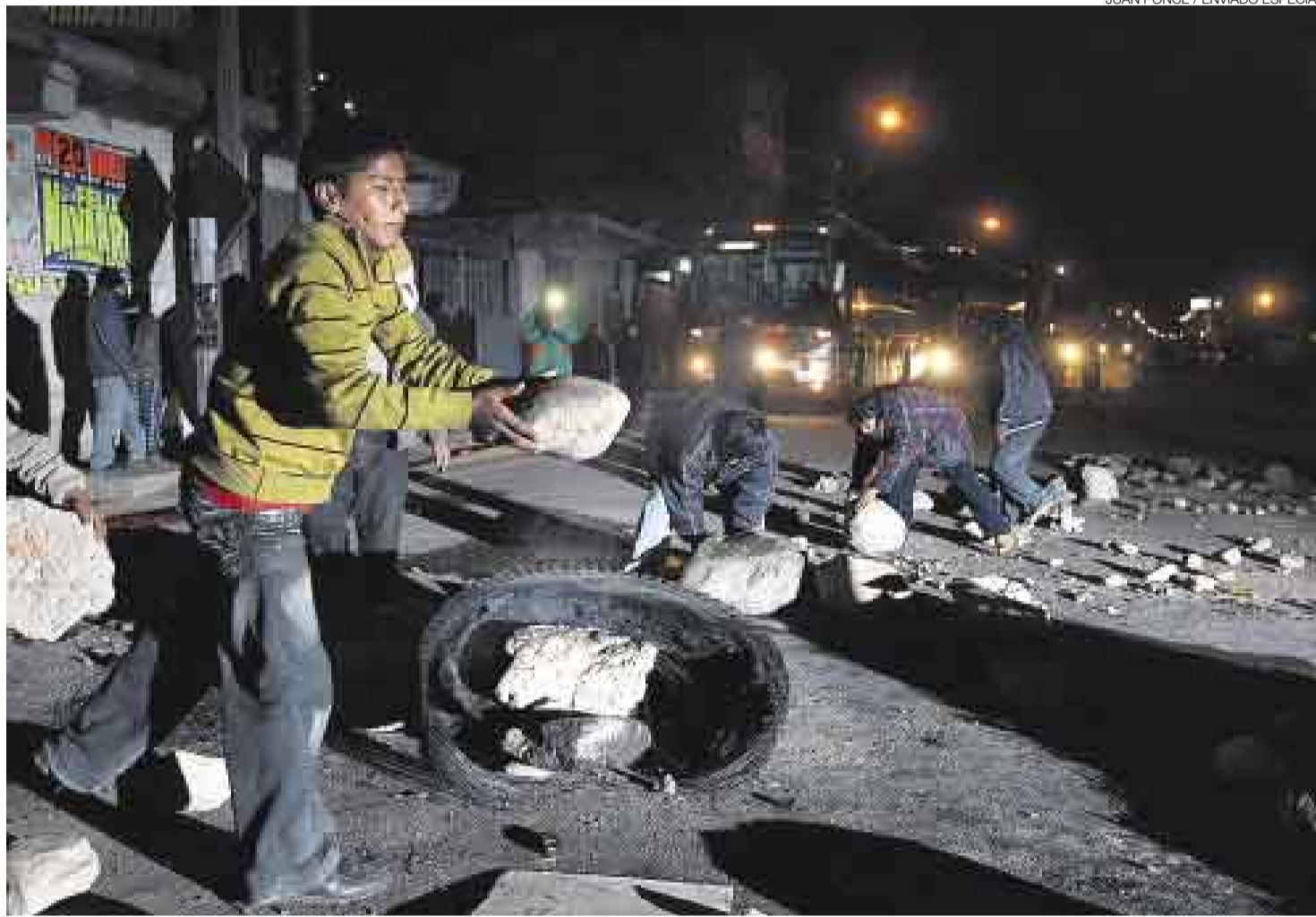
LIMPIEZA. Luego de suspender el paro, algunos manifestantes procedieron a retirar las piedras de la Carretera Central. Los buses lograron pasar.

PEQUEÑOS DISTURBIOS Durante toda la mañana hubo