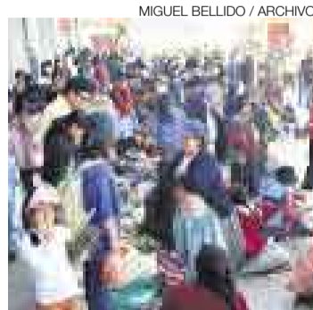
COMERCIO. Los pobladores volvieron a sus rutinas diarias.

Aunque en el aeropuerto la rehabilitación de la pista de aterrizaje será relativamente sencilla, pues solo se colocaron piedras y llantas quemadas, en