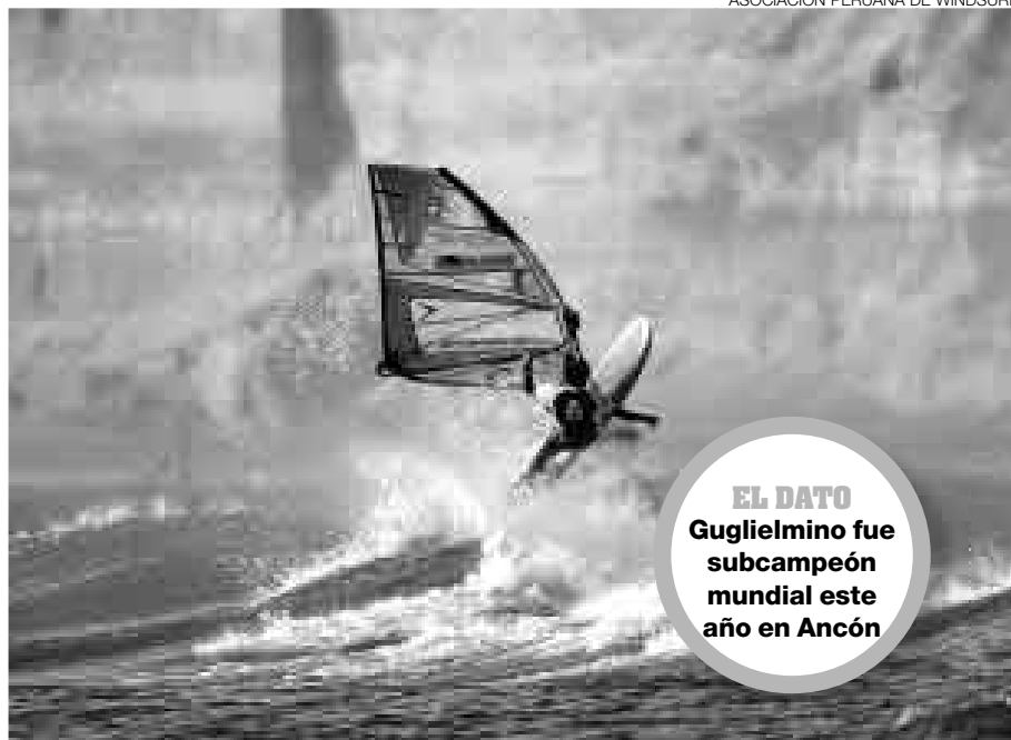
ASOCIACIÓN PERUANA DE WINDSURF