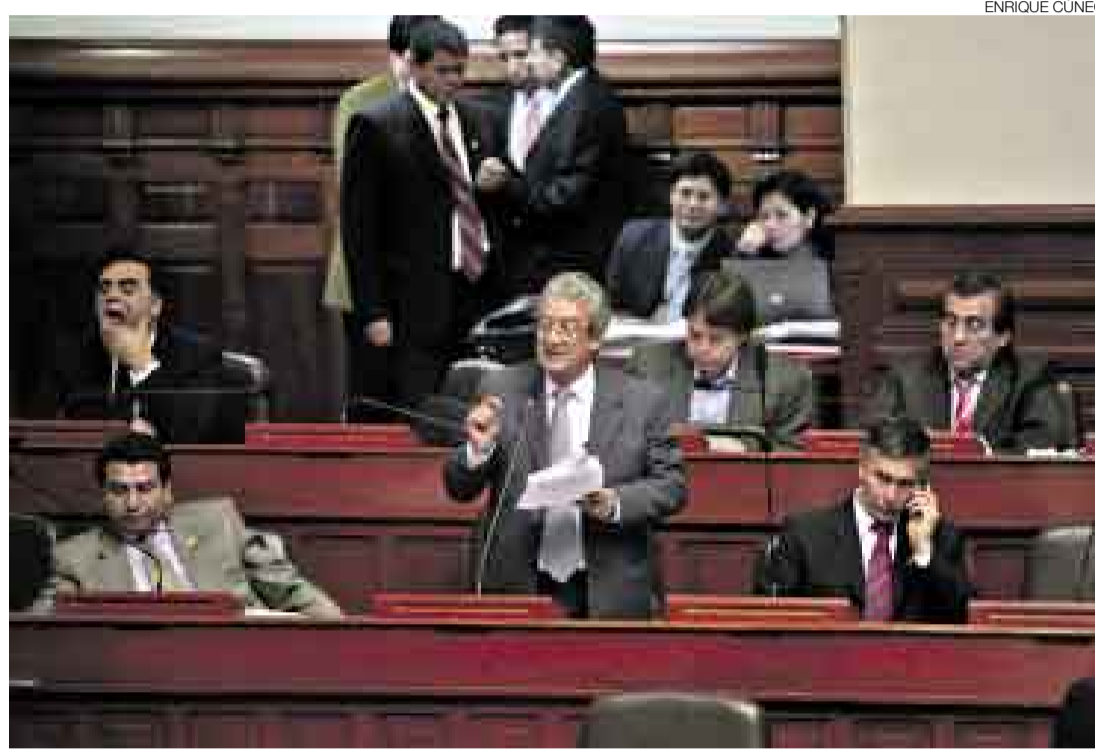
MANIOBRAS. Lejos de dar el ejemplo, los apristas se desaparecieron luego del pleno matutino.

“El Apra no quería cumplir con el pago de favores”, comentó la fuente. Agregó que algunos congresistas de Renovación Nacional y una facción de UPP se