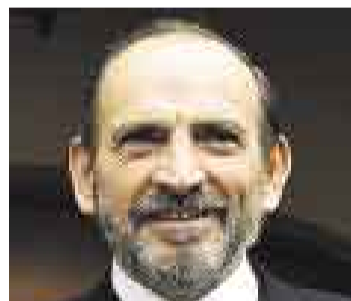
SIMON. Cree que le han hecho una mala jugada a Villa Stein.

“El gran perdedor de todo esto es el Poder Judicial y, doblemente, el país porque este proceso tiene un retraso criminal”, manifestó.