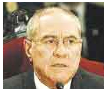
VILLA STEIN. Dijo que Simon ya está fatigado y nervioso.

Según dijo, la decisión judicial “incomoda al país” y pone de manifiesto que la justicia no es igual para todos. Recordó que durante el tiempo que permaneció encarcelado conoció a un hombre que