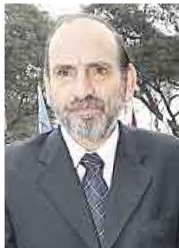
PROPUESTA. Yehude Simon.

“Aspiro a que el frente social incluya al partido de gobierno (Apra), al Partido Humanista, a los frentes regionales y a los independientes. Lo toman o lo