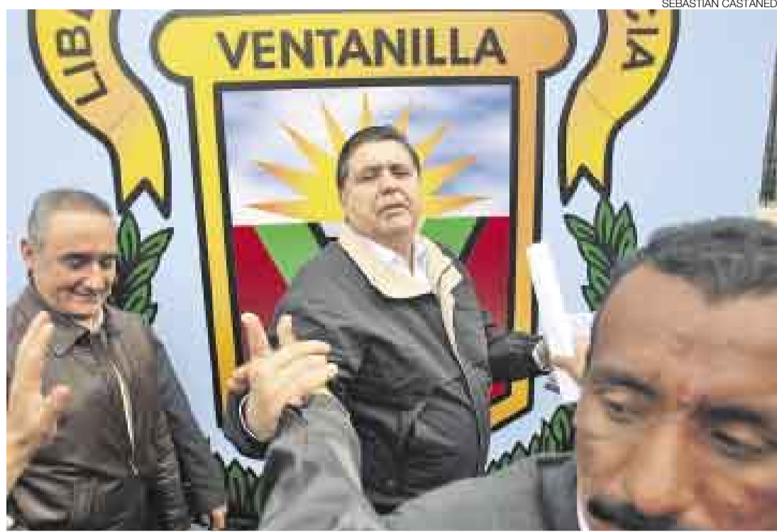
PREFIERE SONREIR. Luego de dos días que se anunciara el relevo de ministros, García no define nada.

El Comercio decidió hablar directamente con el aludido, quien dio a entender que recibió la propuesta, pero la había rechazado: “Yo tengo un perfil más técnico. No tengo una ambición política. Mi trayectoria es más académica, y si he llegado acá tampoco ha sido para hacer política, sino para hacer algunas reformas en educación”.