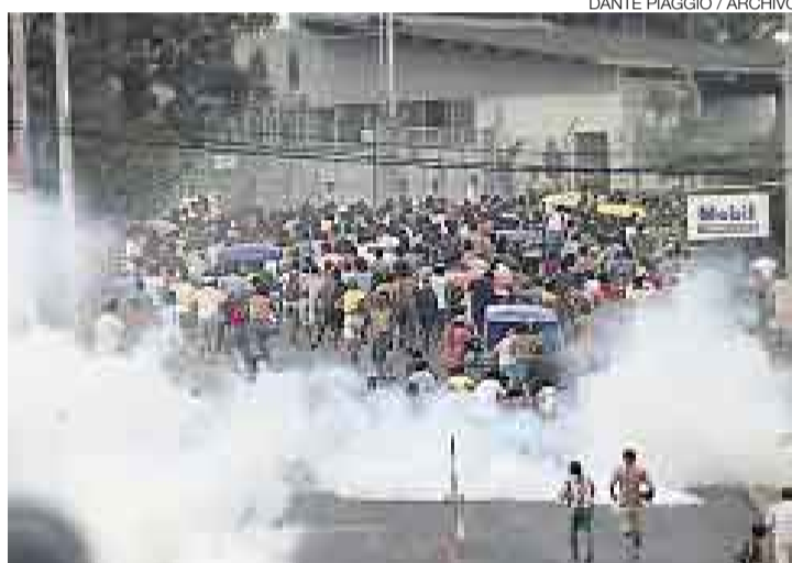
TODOS PERDEMOS. El cese del flujo de petróleo desde la selva por el conflicto en Bagua ocasionó pérdidas por US$69 millones.

■ A fines del 2005 había 33 conflictos sociales. En el 2009 no solo aumentaron a 273, sino que se hicieron más agresivos