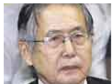
SALUD. Ya está controlada la crisis de hipertensión de Fujimori.

El ex presidente Alberto Fujimori fue trasladado ayer de regreso a la sede de la Diroses, tras 19 horas de haber permanecido en el Instituto Nacional de Enfermedades Neoplásicas (INEN), donde fue sometido a varios exámenes médicos luego de la crisis de hipertensión que tuvo el pasado lunes y que obligó a suspender el juicio por el pago de CTS a Vladimiro Montesinos.