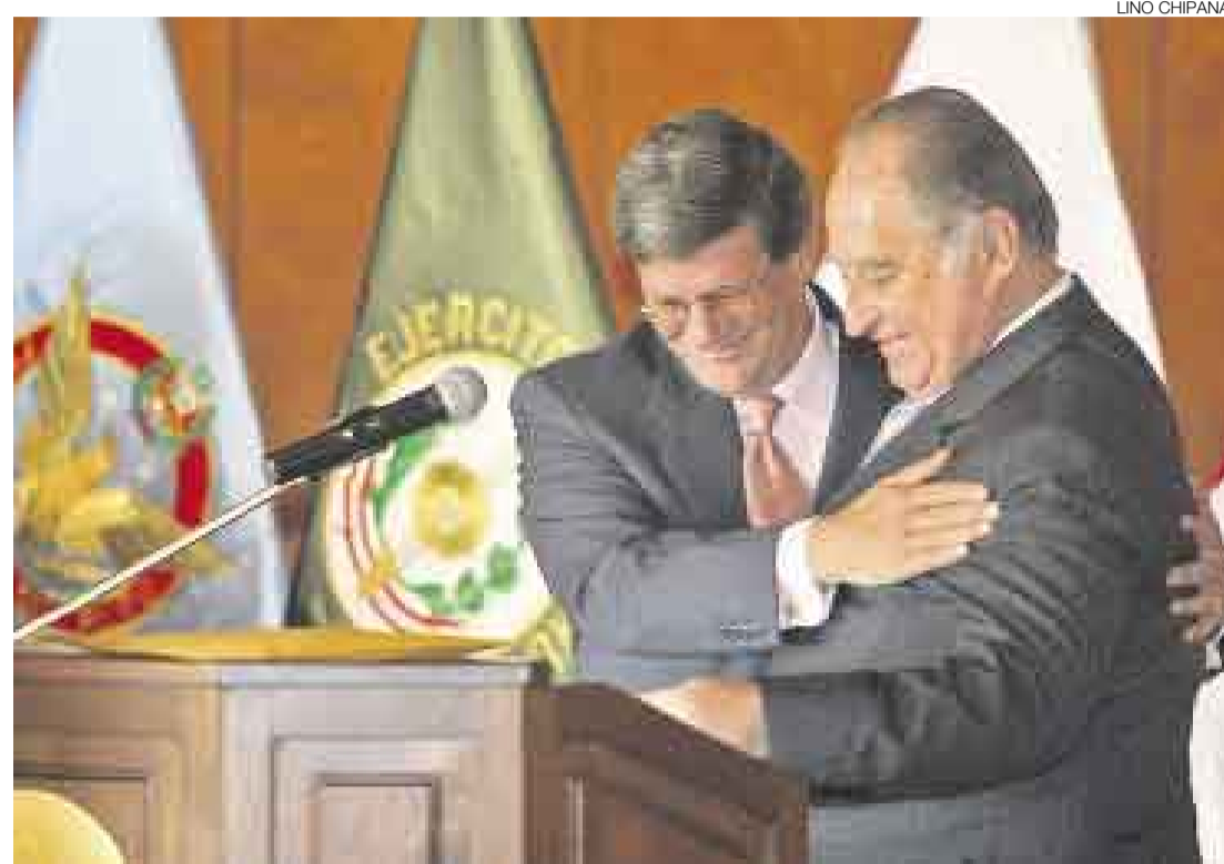
COMO HERMANOS. En la ceremonia de transmisión de cargo, el ministro Rafael Rey y su antecesor Ántero Flores-Aráoz dejaron en evidencia sus semejanzas. Ambos salieron de Unidad Nacional.

de la autoridad. Cuando un gobierno no ejerce la autoridad para restablecer el orden no ayuda al desarrollo del país, al contrario, lo lleva a la intranquilidad, al desorden”, indicó el flamante titular de Defensa. “El ejercicio de la autoridad no solo es un deber, es una obligación”, agregó.