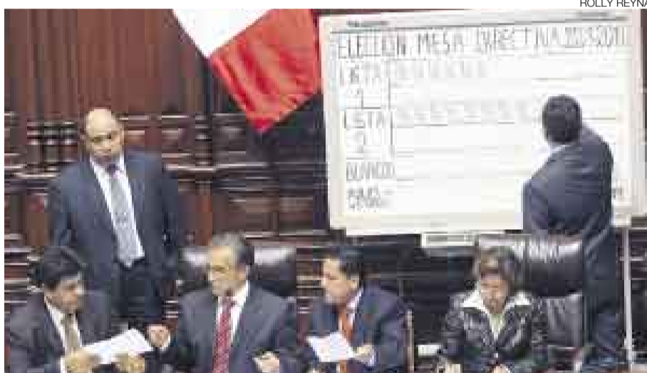
PIZARRITA. El proceso de votación en el Parlamento duró una hora y cinco minutos.

■ José Luna (SN), Margarita Sucari (BP), Gustavo Espinosa (NA), David Waisman (PP) y Aldo Estrada (UPP) votaron súbitamente por el Apra