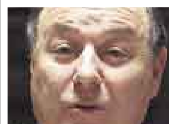
RAÚL CASTRO SECRETARIO GENERAL DEL PPC

“No es nada despreciable el porcentaje de peruanos que está a favor de una alianza electoral entre Flores, Toledo y Castañeda. Es más del doble de lo que cada uno de ellos tiene en la intención de voto. Obviamente, el electorado humalista, fujimorista y aprista es el que está en contra”.