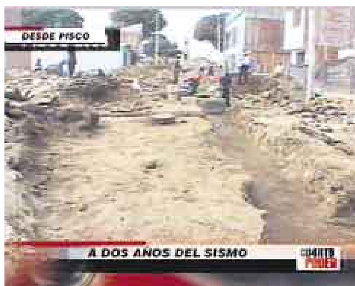
INACCIÓN. La demora en la reconstrucción del sur chico, en especial de Pisco, motivó evocaciones de la tragedia y denuncias a las autoridades.