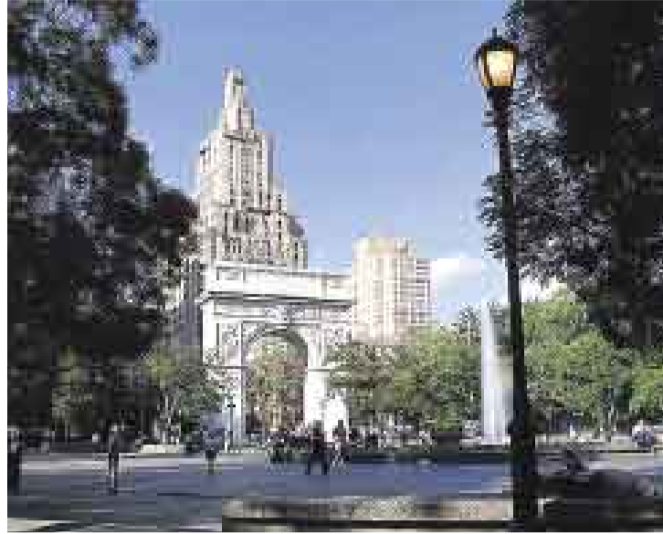
WASHINGTON SQUARE. Uno de los espacios más conocidos que ofrece la siempre visitada ciudad de Nueva York.