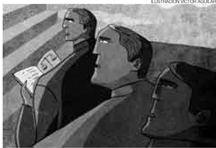
ILUSTRACIÓN VÍCTOR AGUILAR

Consolidemos la presencia de la Defensoría del Pueblo y hagamos de ella una institución moderna para la defensa de derechos y la supervisión de la administración estatal. Esa es la máxima que ha guiado la gestión que tuve el honor de iniciar en el 2005. Recibí el encargo de dirigir una entidad estatal cuya fase fundacional había sido sólidamente desarrollada por mis predecesores. El momento exigía, en consecuencia, su relanzamiento para los nuevos tiempos, y el fortalecimiento de su envergadura como institución más allá de las personas.