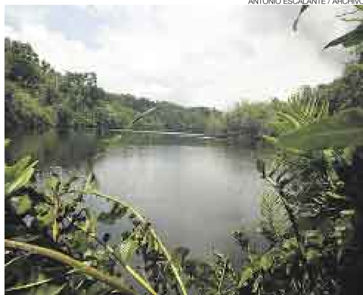
EL OJO DE LA TORMENTA. El tema de las exoneraciones tributarias para la Amazonía es un debate que no tiene visos de acabar pronto.