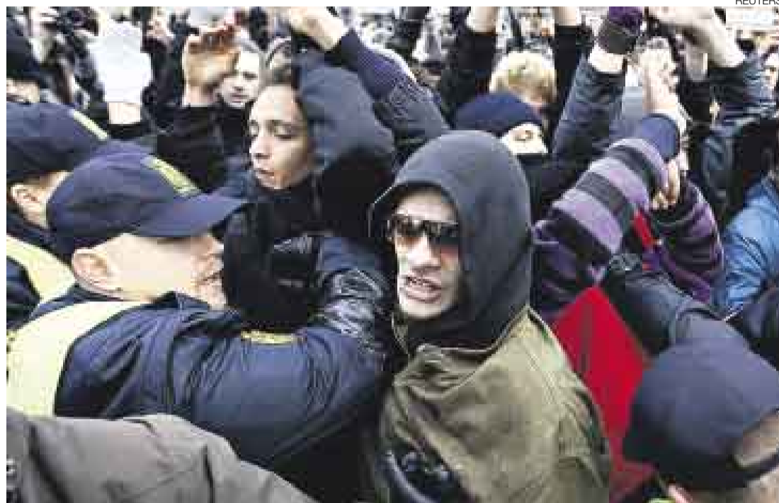
INCIDENTES. Las protestas se han convertido en algo cotidiano en la capital danesa. Aún queda una semana.

La secretaria de la ONU para el clima recibió el anuncio con entusiasmo: "Resulta muy motivador que la UE finalmente ponga dinero sobre la mesa;