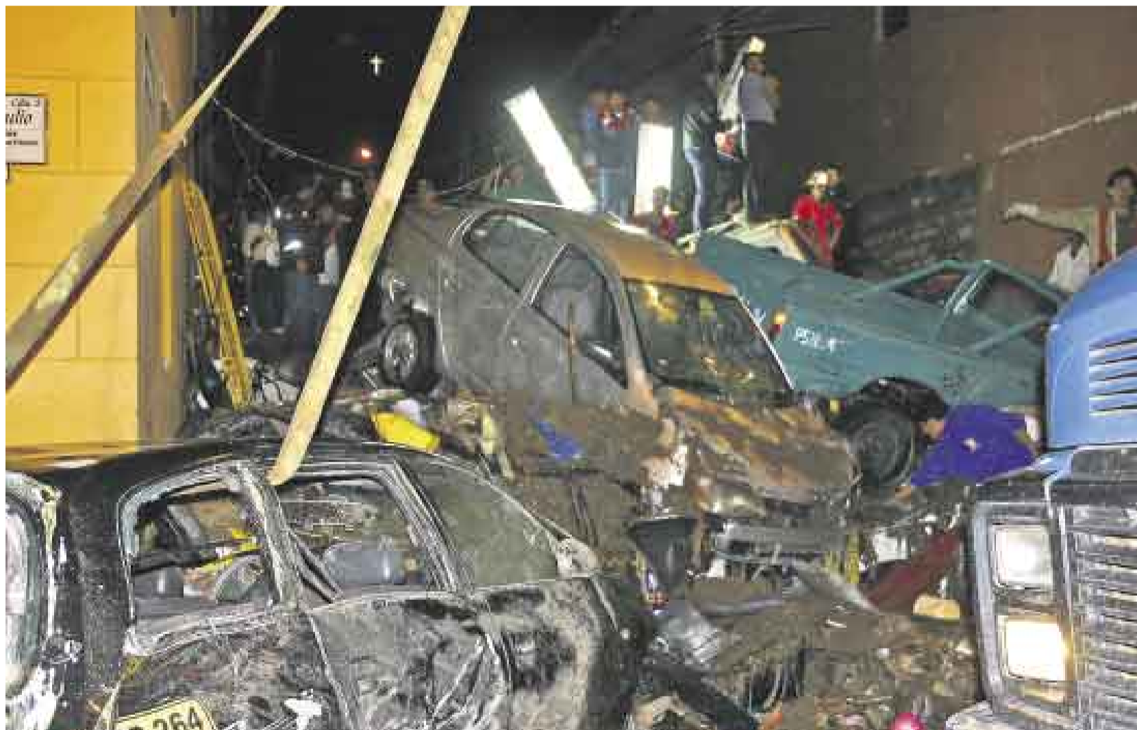
FURIA DE LAS AGUAS. Tan violento fue el torrente que vehículos de diverso tamaño quedaron apilados en los estrechos jirones del casco histórico huamanguino.

Al menos seis personas murieron arrastradas por el alud