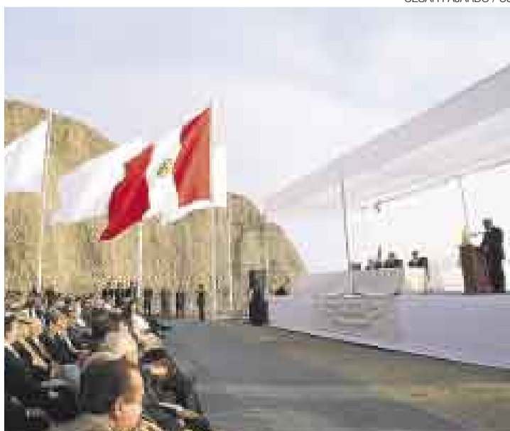
CON VISTA AL MAR. El museo que servirá para recordar los horrores del terrorismo ya tiene un emplazamiento definido. Ayer fue la entrega oficial.

■ Vargas Llosa: No se desprestigiará a las FF.AA.