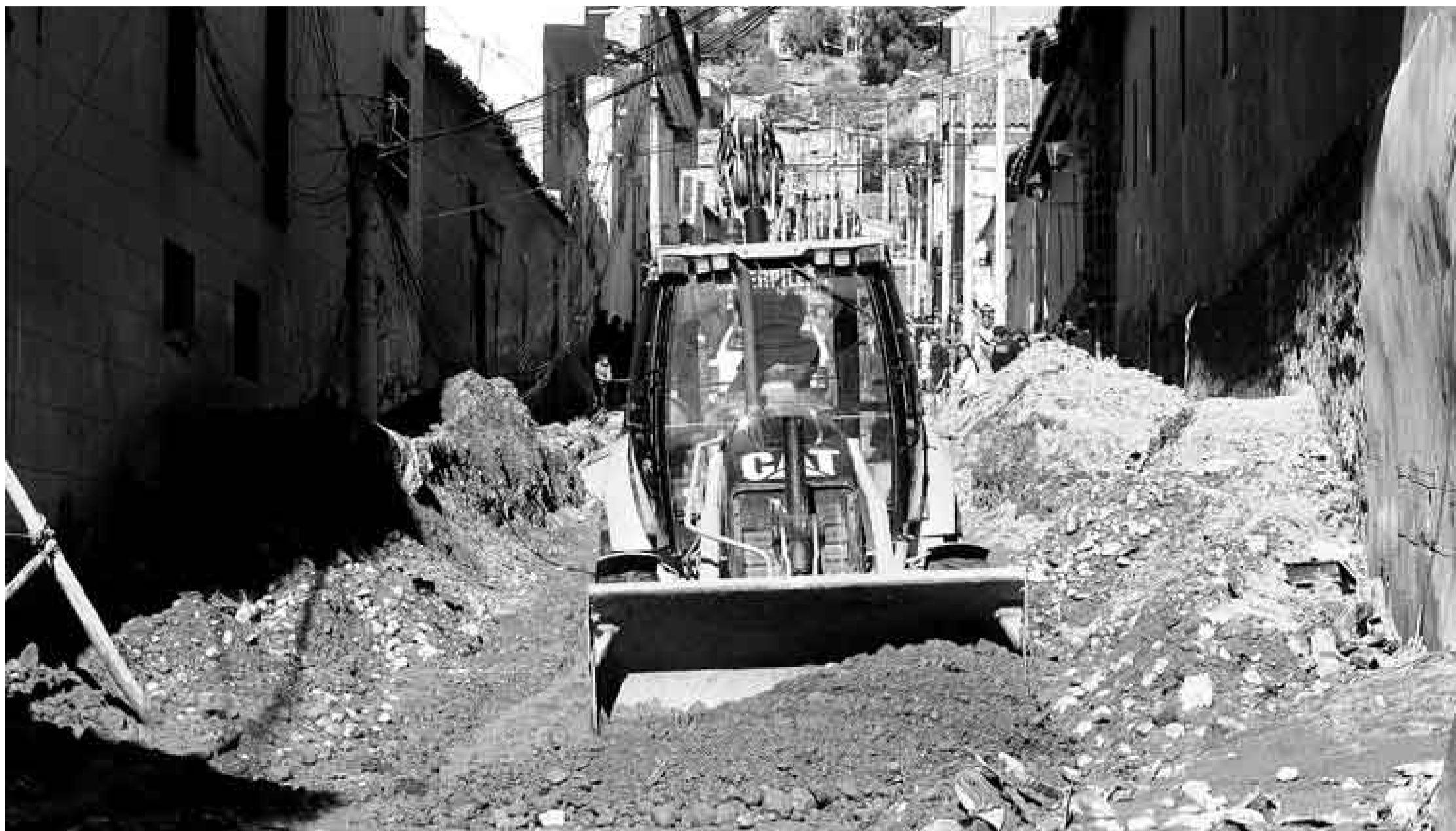
UNA HORA QUE CAMBIÓ TODO. A las 6:30 p.m., tras una lluvia intensa de una hora, el centro de la ciudad fue alcanzado por un violento torrente de agua, lodo y piedras que alteró el bello rostro de Ayacucho.