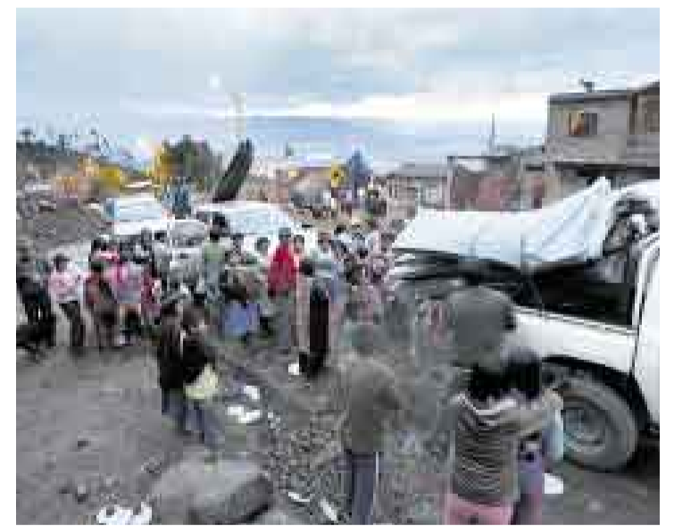
NECESIDAD. Muchos pobladores del cerro La Picota recién pudieron recibir las colchonetas repartidas a partir de las 6:30 p.m. de ayer.

JAVIER VELÁSQUEZ QUESQUÉN PRIMER MINISTRO