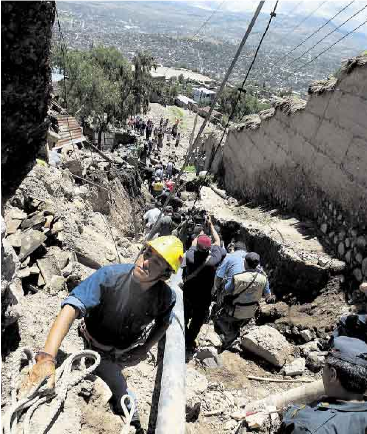
SIN MURO DE CONTENCIÓN. La vorágine de lodo y piedras dejó expuestas las tuberías de agua y desagüe. Estas colapsaron.

■ Ayacucho, que en quechua significa rincón de los muertos, lloraba ayer su última tragedia. Que no nos sorprenda que también esta vez la ciudad que le dijo no al terror saldrá adelante