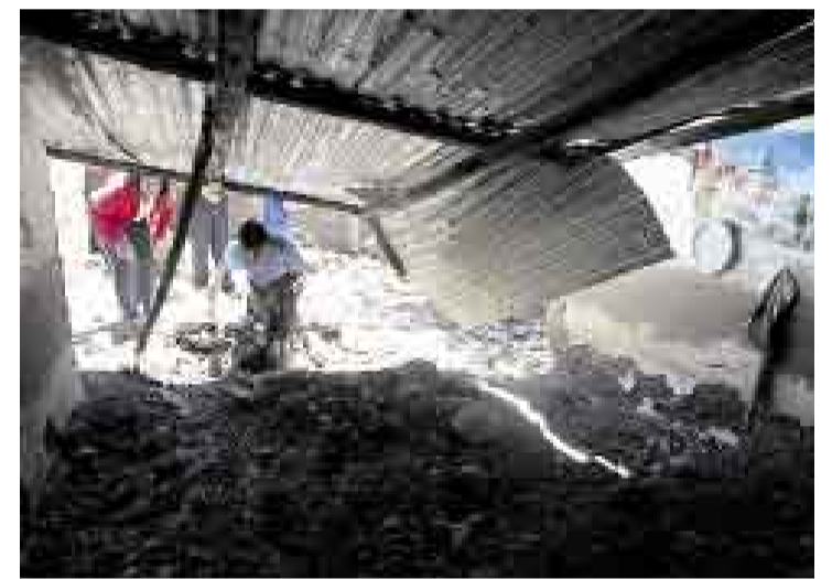
ESCOMBROS. La casa de la familia Ochoa quedó destruida. La promesa es que serán reubicados en carpas temporales.