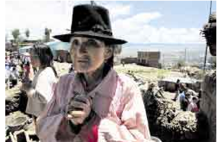
LO PERDIERON TODO. Son 54 damnificados y 630 afectados tras el alud que sorprendió a los pobladores de La Picota la noche del miércoles.