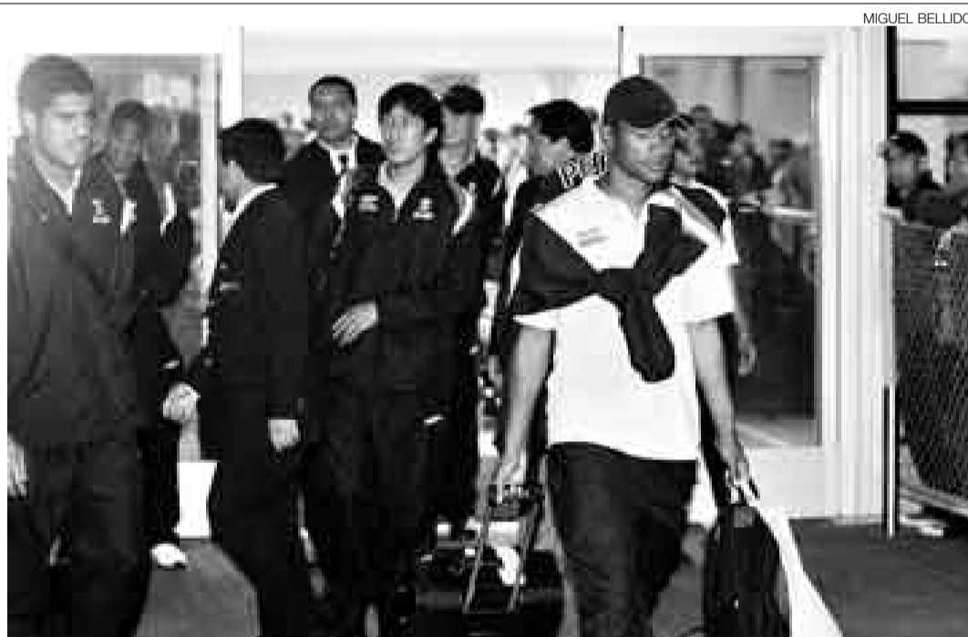
TEMOR. La delegación peruana se inquietó porque no pudo jugar y por el retraso del vuelo a Lima.

La selección peruana lamentó haber viajado a España en vano. El mal tiempo no solo le impidió disputar ayer el partido amistoso contra Ecuador en el estadio Vicente Calderón, sino que su vuelo de retorno a Lima—inicialmente programado para la noche de ayer—se vio retrasado y hasta el cierre de esta edición no había autorización para la partida.