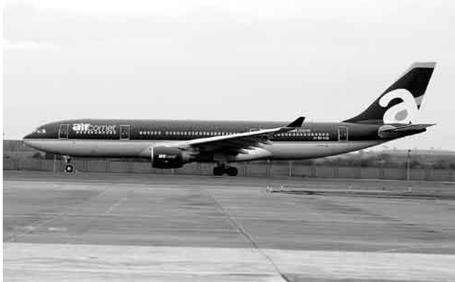
SE QUEDÓ EN TIERRA. Un juez británico ordenó la inmovilización de 13 naves similares a la de esta foto. Cientos de peruanos habían comprado pasajes.

El magistrado británico también ordenó, desde el viernes pa-