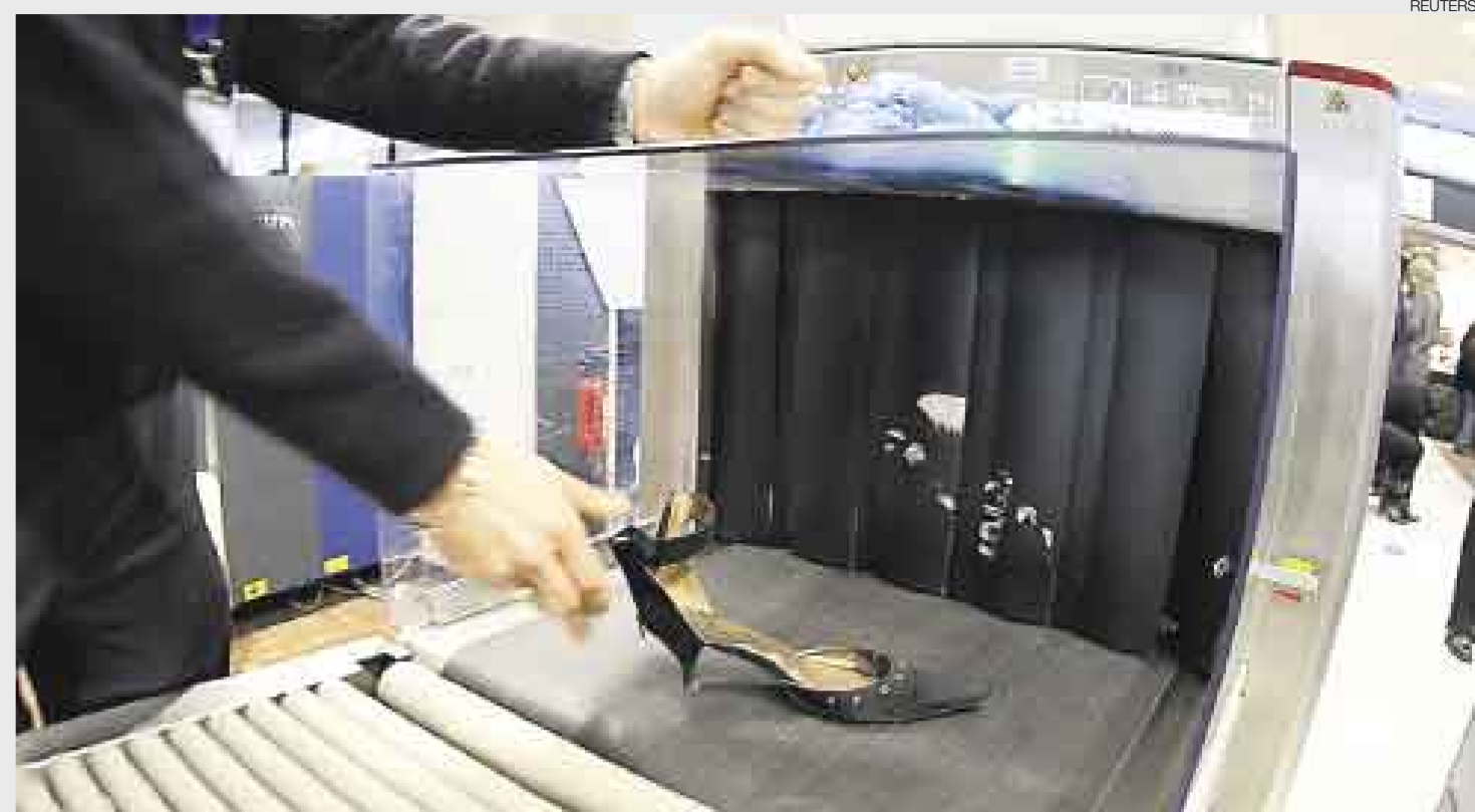
CONSECUENCIAS ▲ Personal del aeropuerto francés de la Costa Azul pasa por un escáner el zapato de una mujer como parte de los nuevos y severos protocolos de seguridad impuestos tras el atentado fallido a un avión estadounidense en la ruta Amsterdam-Detroit el día de Navidad.