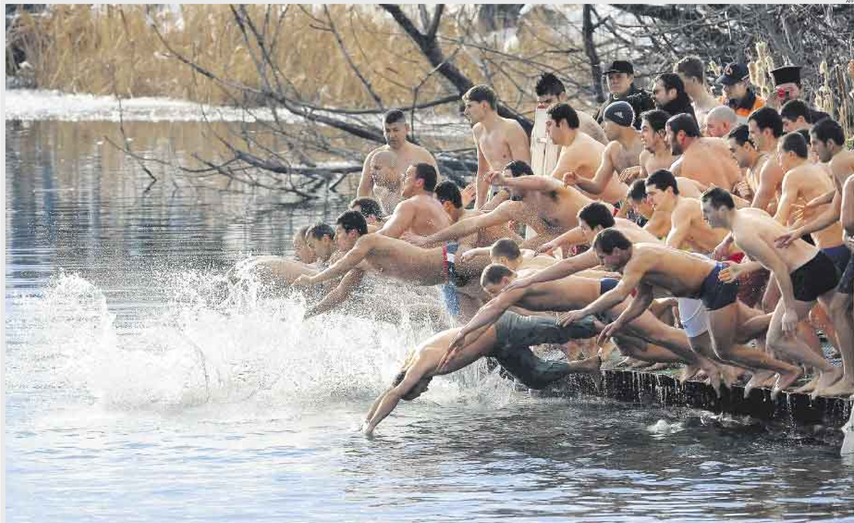
TRADICIÓN ▲ Búlgaros saltan al agua helada en una competencia para coger una cruz lanzada por un sacerdote de la Iglesia Ortodoxa en un lago en la capital Sofia, durante el Día de Epifanía. Según la creencia, el primero que la encuentre tendrá buena salud todo el año.

▲ Jóvenes monjes budistas asisten al segundo día de enseñanza del Dalai Lama, cerca del histórico Templo Mahabodhi, en la India, lugar donde la tradición cuenta que Buda logró la iluminación. El dirigente espiritual budista pasará una semana allí rezando e instruyendo a sus seguidores.