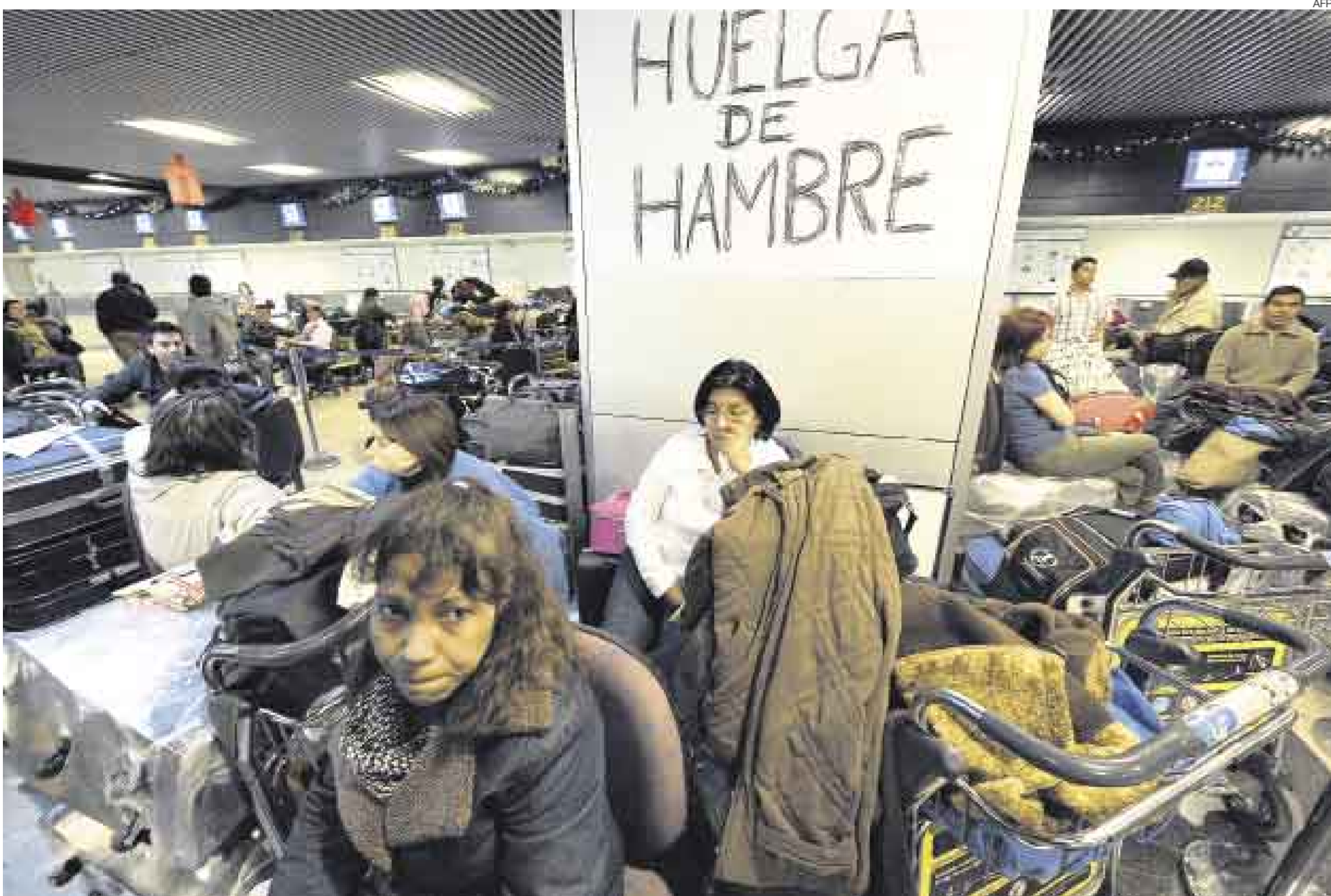
SIN DEVOLUCIÓN. Es muy poco probable que los afectados por el cierre de la aerolínea Air Comet recuperen lo que gastaron en unos pasajes que ahora resultan inservibles para todos.