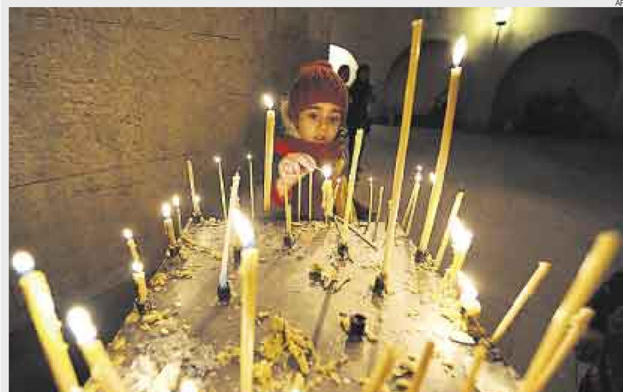
NAVIDEÑOS ▲ Una niña enciende una vela en una iglesia en Tiflis, Georgia, el 7 de enero por Navidad, día en que la mayoría de cristianos ortodoxos celebran esta fecha pues usan el viejo calendario juliano en vez del gregoriano adoptado por católicos, protestantes y los ortodoxos griegos y que es utilizado comúnmente en la vida secular en el mundo entero.

TEMORES. El intento de Al Qaeda de volar un avión estadounidense ha puesto en alerta los sistemas de seguridad de los aeropuertos del mundo entero. En otras zonas del planeta, la tradición y la fe siguen inspirando a muchos.