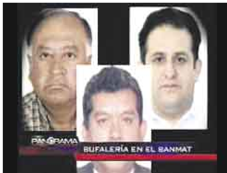
COPADOS Y LIADOS. La 'bufalería' ajustó cuentas con un militante aprista que denunció irregularidades en el Banco de Materiales.

TJERODICE QUENO. "Reportesemana" entrevistó al narco Lucio Tijero en su celda del penal Castro Castro, la que no se vio dorada,