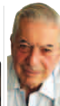
Mario Vargas Llosa

Escritor, premio Nobel de Literatura 2010