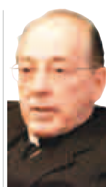
Juan Luis Cipriani