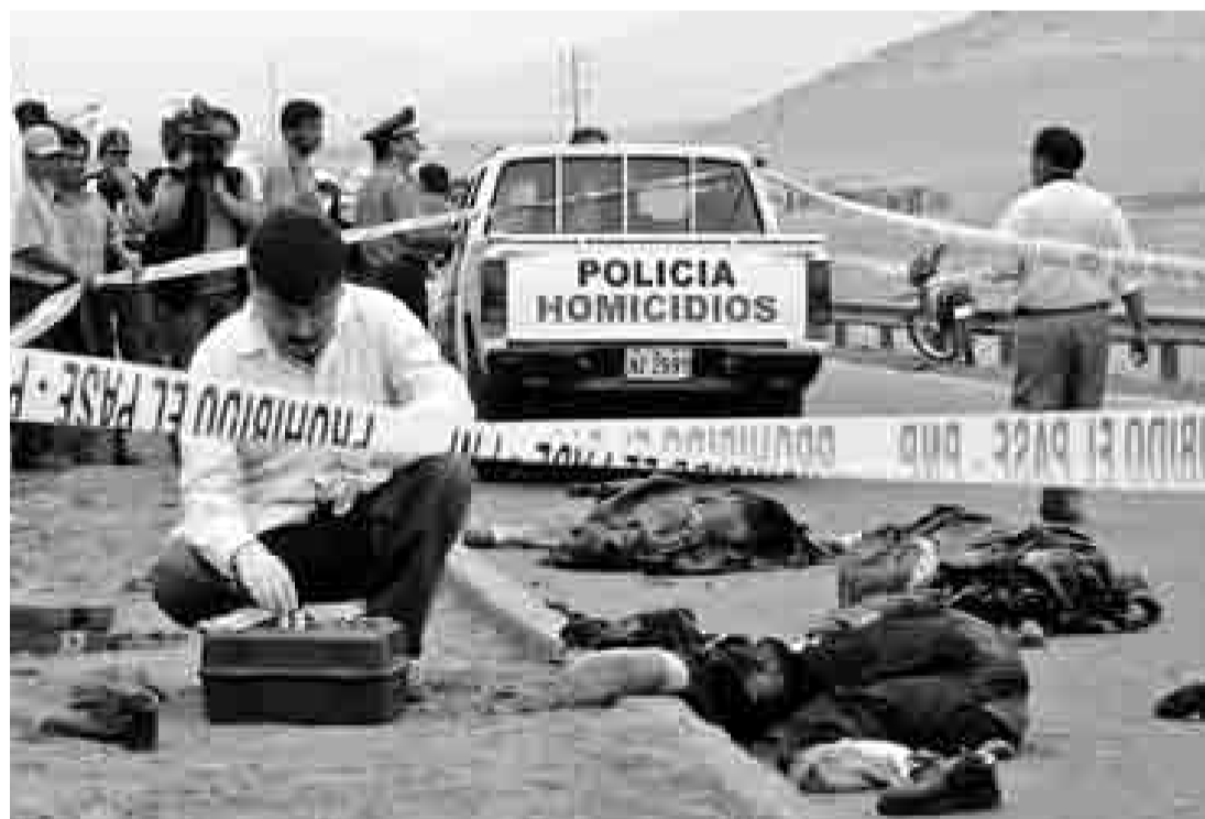
VIOLENCIA. En la campaña, el presidente electo prometió cero corrupción y recuperar la seguridad.

Al parecer, el nuevo jefe del Estado deberá concentrar sus fuerzas, más que en sus programas sociales, en asegurar calles tran-