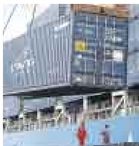
PARTES IGUALES. MINERAS SE PUSIERON DE ACUERDO.

Los mineros que embarcan sus concentrados por el puerto del Callao finalmente habrían llegado a un acuerdo sobre la participación que cada empresa ( Cormin , Chinalco , Glencore , y Sociedad Minera El Brocal ) tendrá en el proyecto para la construcción del muelle de minerales en el rompeolas norte. Todo apunta a que las cuatro mineras tendrían una participación de 25% en una empresa a la que bautizaron como Transportadora del Callao . El muelle sería operado por Santa Sofía Puertos del Grupo Romero .