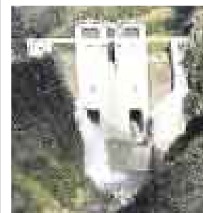
AGUA. LA INVERSIÓN EN ENERGÍA TIENE UN GRAN POTENCIAL.