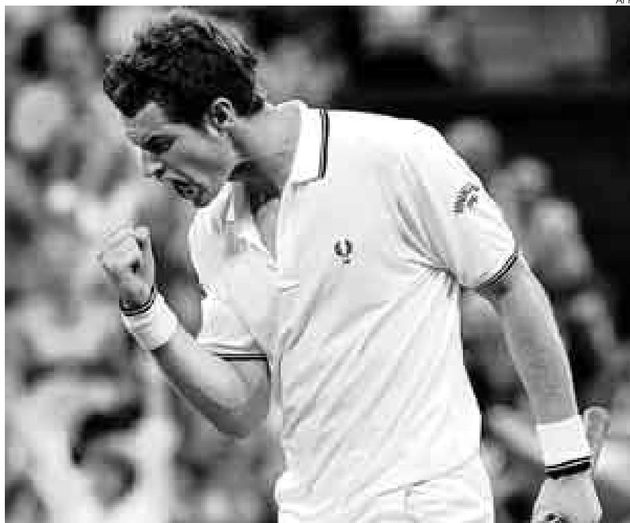
CON SUSTO. El escocés Murray necesitó cinco sets para superar al difícil Wawrinka.

El agua obligó a interrumpir en el segundo setel