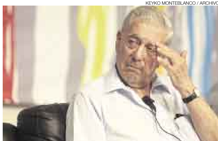
EXPECTATIVA. El laureado escritor peruano Mario Vargas Llosa espera que Ollanta Humala se distancie de Hugo Chávez.

MADRID. “Al vernos me explicó que él era amigo de Hugo Chávez (el presidente venezolano), pero que su posición no es exactamente la de Chávez. Que él tiene muchas discrepancias que poco a poco las irá haciendo públicas, pero siempre sin atacar a Chávez porque insiste en que es su amigo. Me explicó, además, que no es enemigo de la inversión ni de la empresa privada, y que acepta eso a condición de que el Estado tenga el control de la política económica”.