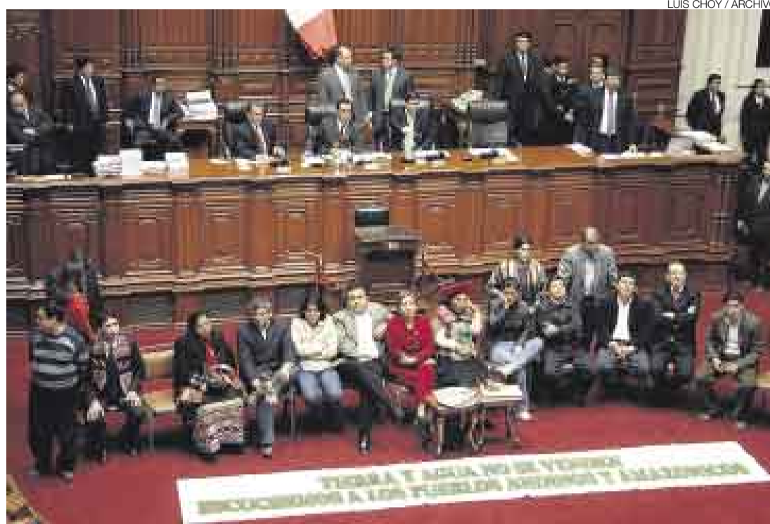
¿VOLVERÁN? Los humalistas fueron suspendidos por protestar contra decretos sobre la Amazonía.