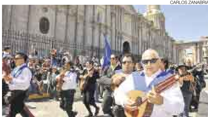
SIGUE EL TURISMO. Se espera la llegada de 22.000 visitantes.

En Arequipa ya se respira el ambiente de fiesta por el aniversario 469 de su fundación, cuyo día principal es este sábado 15. Sin embargo, también se viven las primeras consecuencias que ha dejado la gripe AH1N1: trece personas muertas y otras 488 portadoras de