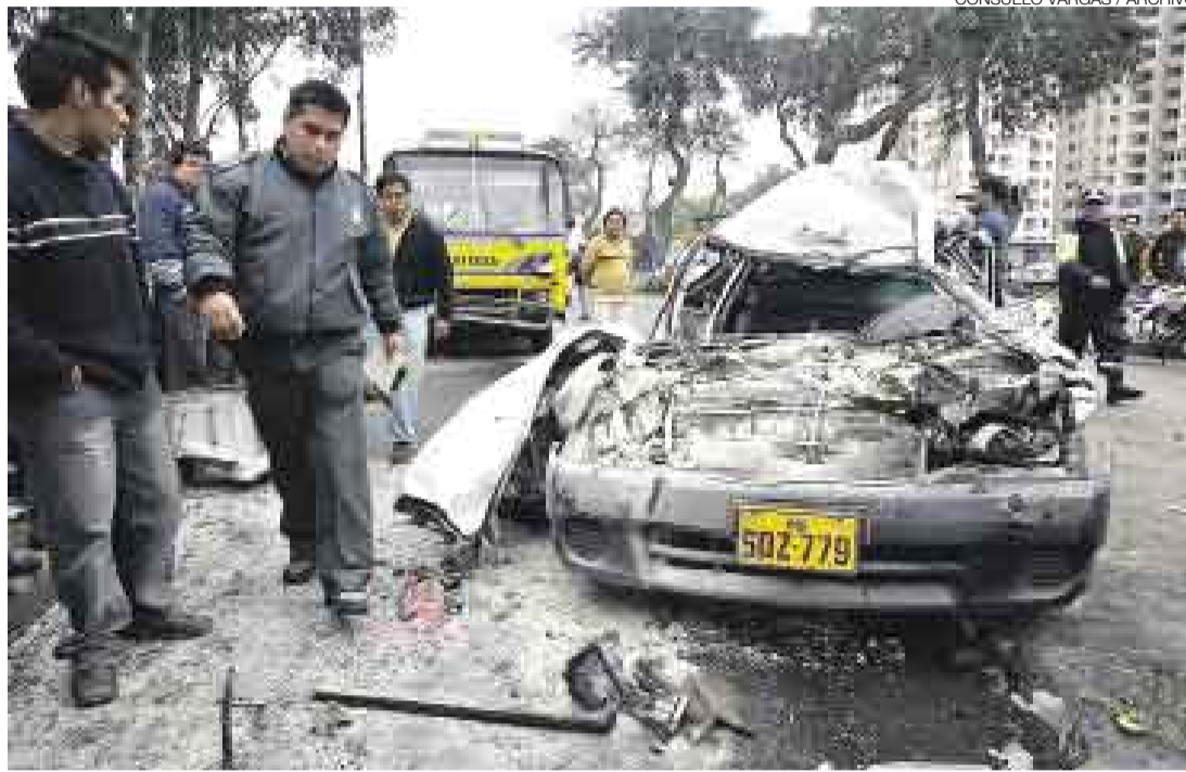
ABUSO. La defensoría ha recibido el mayor número de quejas en La Libertad, Ayacucho, Junín y Cajamarca.

"Si una Afocat es cancelada, otra de la misma región asume a sus asegurados", rebatieron voceros de la Superintendencia