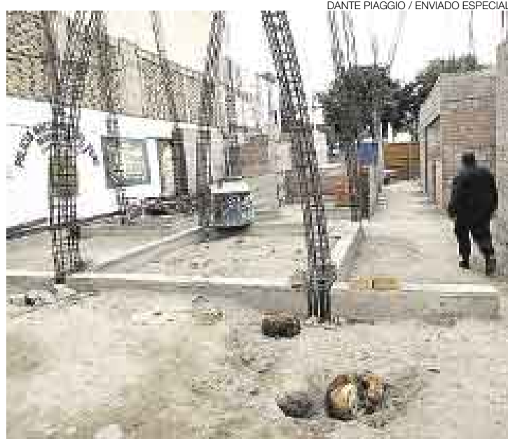
DESPERDICIO. La primera planta de la nueva comisaría de Pisco tendrá que ser demolida. Reforzar las obras saldría más caro.

“Hay graves deficiencias en la edificación de esta obra. Se ha registrado un nivel freático a tan solo dos metros y medio de profundidad y componentes del suelo (sales) extremadamente