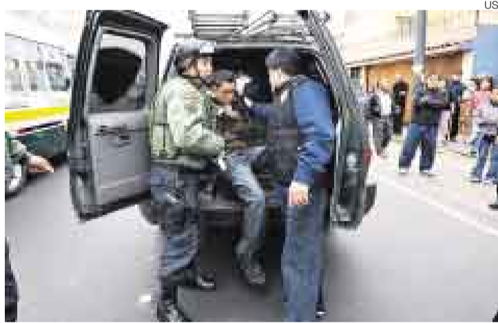
'MARCAS' DETENIDOS. Un dato de Inteligencia permitió la captura de cinco pistoleros que asaltaban con la modalidad conocida como 'marca'.

La balacera causó pánico entre los automovilistas y peatones. El tránsito en la cuadra 9 de