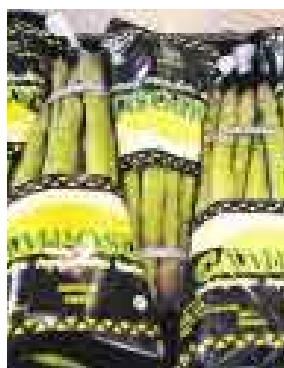
VENTAS. VOLUMEN CRECIÓ.

Bustamante dice que el volumen de sus productos exportados (espárragos frescos y congelados) subió en poco más del 30%. “Este no es un año bueno, pero por ser el espárrago un producto gourmet,