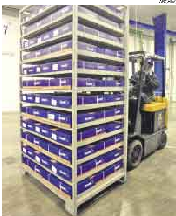
DIVERSIFICA. TASA INICIÓ LA EXPORTACIÓN DE ANCHOVETA CONGELADA A ESPAÑA Y RUMANÍA. BUSCAN AMPLIAR SUS MERCADOS.

dan una inversión de US$25 millones, concluirán en marzo del 2010.