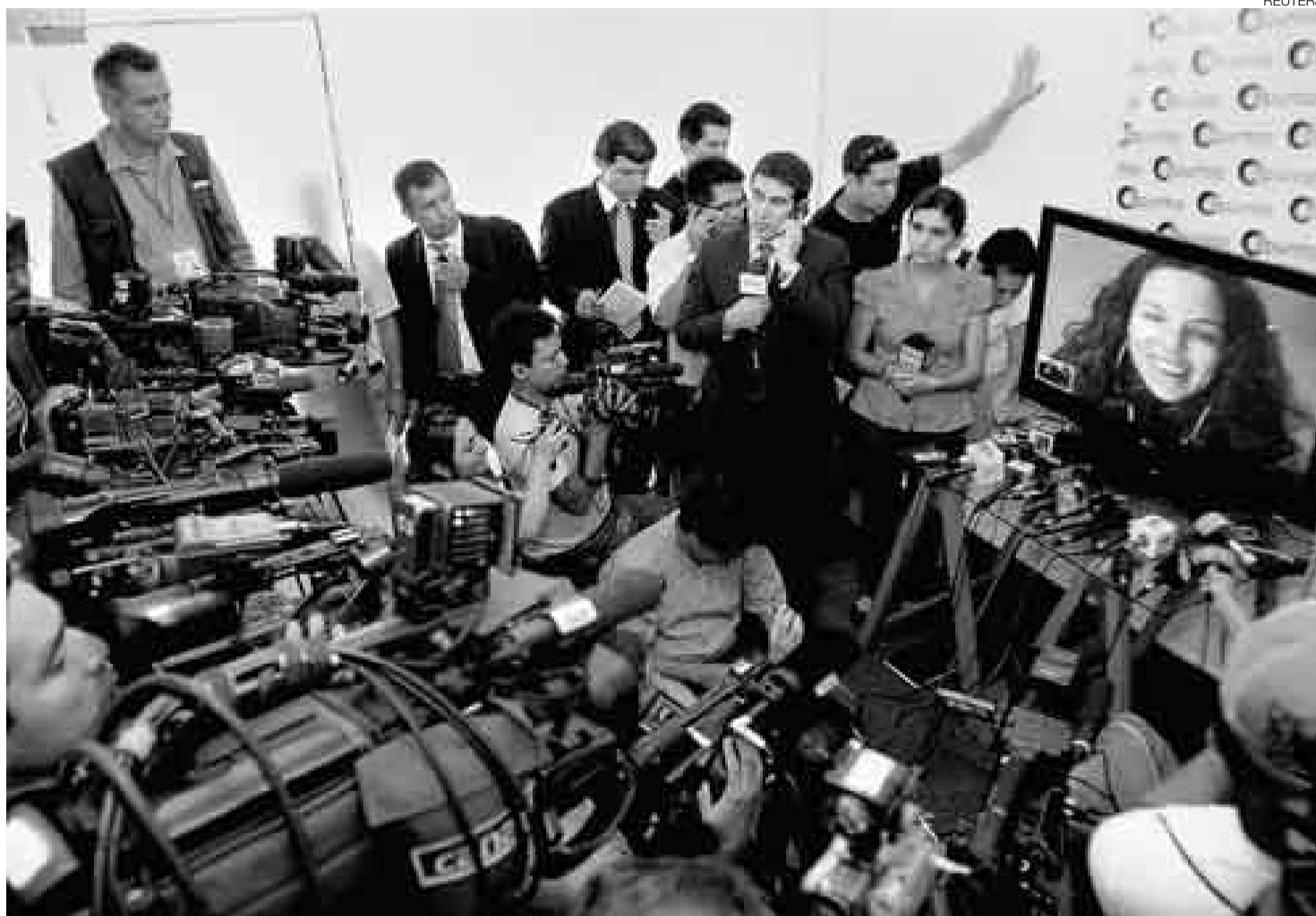
EN LA MIRA. Decenas de medios nacionales e internacionales se reunieron ayer para escuchar a Claudia Llosa en videoconferencia.

En tanto los distribuidores peruanos evalúan volver a poner en pantalla la película de Claudia Llosa, debido a la cercanía de la ceremonia de los Óscar, se pueden comprar DVD originales de "La teta asustada" en las tiendas de Phantom Music.