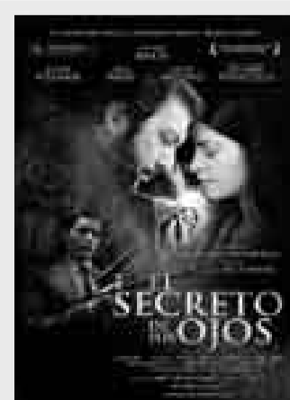
PRESENCIA LATINA. "El secreto de sus ojos" de Campanella.

Y lo hace con la apelación de lo universal, de una fábula enraizada en un lugar y época muy precisos, pero capaz de movilizar sentimientos compartidos por muchos. La historia de Fausta (Magaly Solier), personaje principal de la cinta, es la de una joven que busca superar su ligazón a un miedo ancestral, a una violencia heredada, a un trauma del pasado, para poder florecer, abrirse a nuevas posibilidades de vida y encontrar su sexualidad. Su tra-