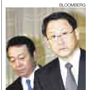
AKIO TOYODA. La imagen de la empresa se ha debilitado.

■ Legisladores piden explicaciones por lenta reacción ante peligro en sus autos