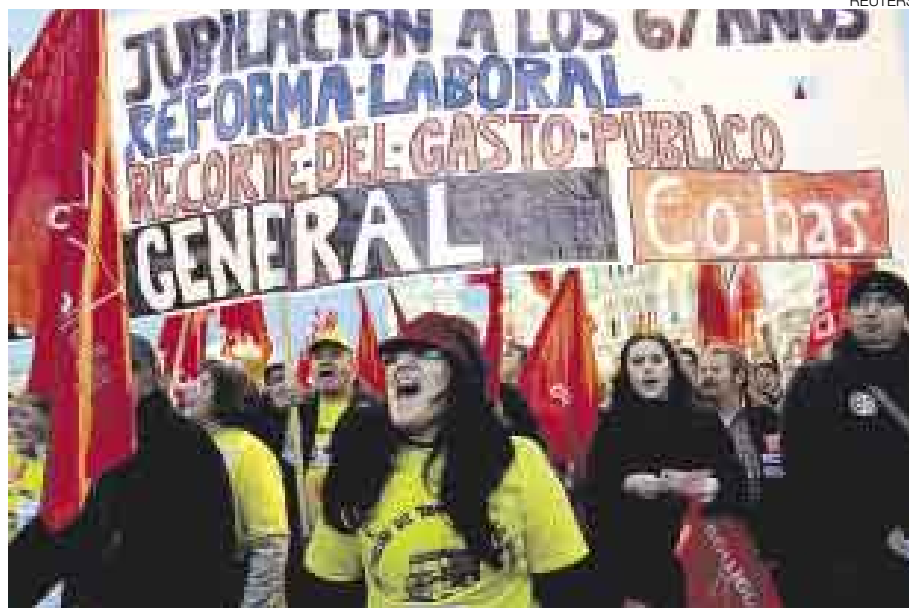
PROTESTAS. Al Gobierno Español le será difícil aprobar la reforma de pensiones.

El eslogan de la convocatoria fue elocuente: "En defensa de las pensiones. No al retraso de la jubilación".