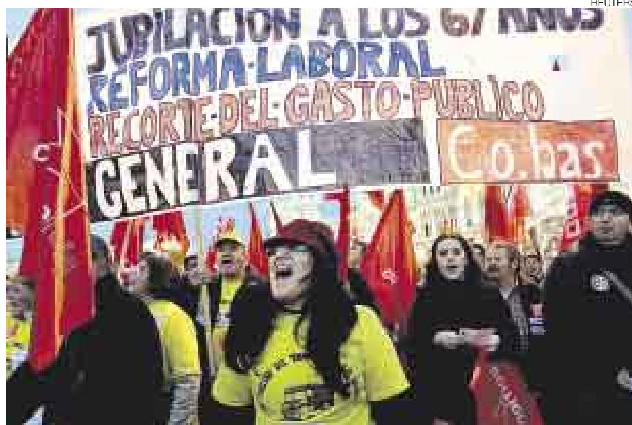
PROTESTAS. Al Gobierno Español le será difícil aprobar la reforma de pensiones.

El eslogan de la convocatoria fue elocuente: "En defensa de las pensiones. No al retraso de la jubilación".