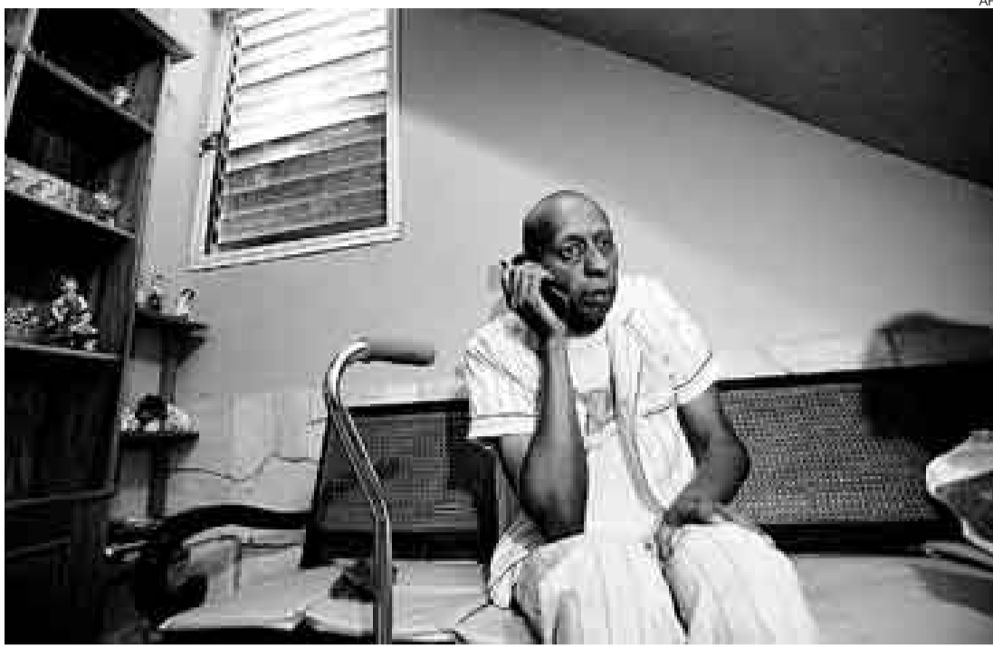
MEDIDA EXTREMA. Guillermo Fariñas se ha convertido en un símbolo de la oposición cubana.