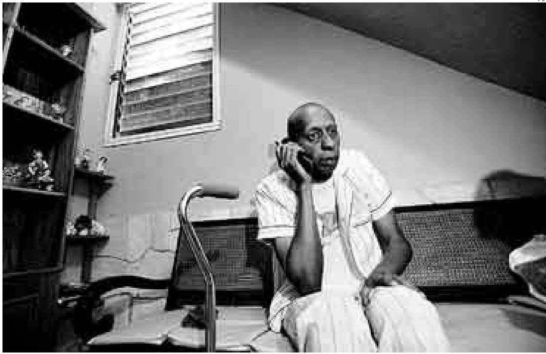
MEDIDA EXTREMA. Guillermo Fariñas se ha convertido en un símbolo de la oposición cubana.