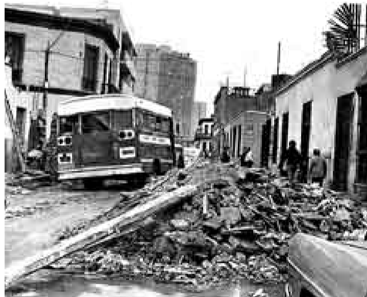
DAÑOS. Los terremotos de la década del setenta revelaron los riesgos a los que están expuestos algunos sectores de Lima por el suelo inestable.

La municipalidad ha repartido folletos con recomendaciones casa por casa.