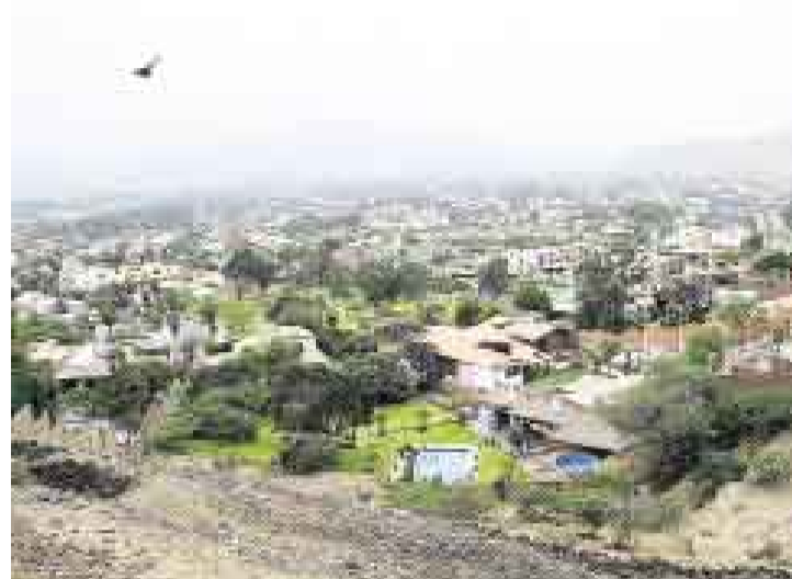
VULNERABLE. La Molina Vieja, una urbanización ubicada al pie del cerro Centinela, está comprendida en la zona con la peor calidad de terreno.