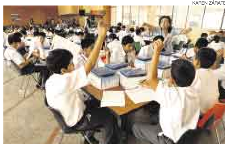
PRIMER DÍA. El entusiasmo saltaba a la vista entre los alumnos del Colegio Mayor. El plantel cuenta con 863 estudiantes.