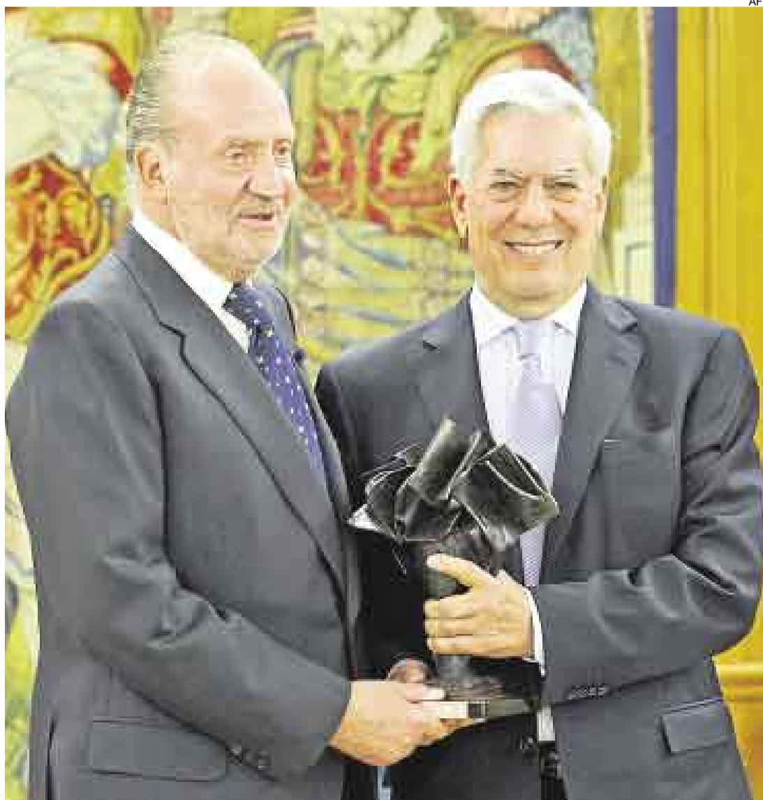
GALARDÓN. Mario Vargas Llosa recibió ayer de manos del rey Juan Carlos el premio Don Quijote.

queremos tener valores y desvalores claramente definidos.