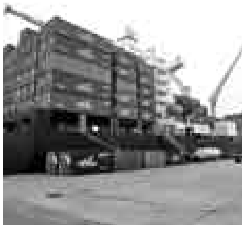
POLÉMICA. Los servicios en el Muelle Sur aún genera debate.

Nuestra capital es la novena ciudad en Latinoamérica con mayor atractivo para la inversión, reveló un informe elaborado por una universidad colombiana y una consultora chilena, que fue dado a conocer esta semana. Especialistas sostuvieron que esto se debe a que muchas empresas han buscado realizar inversiones con buenos retornos y menor riesgo.