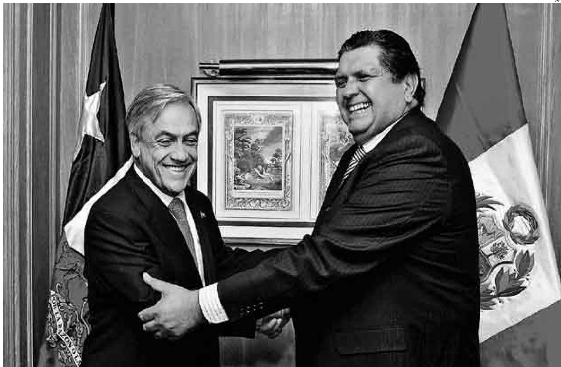
POR BUEN CAMINO. Los presidentes del Perú, Alan García, y de Chile, Sebastián Piñera, se mostraron satisfechos con el encuentro sostenido en Madrid.

El presidente Alan García Pérez asistirá hoy a la Cumbre Empresarial, que se realiza en Madrid, y expondrá sobre la situación económica del Perú.