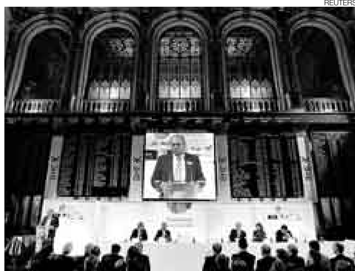
CUMBRE. Madrid recibe a líderes de sesenta naciones. También se dan cita en esa ciudad empresarios de estos países.

Hasta ayer se contaba con la asistencia de la mayoría de líderes, con excepción del uruguayo José Mujica, del venezolano Hugo Chávez, del cubano Raúl