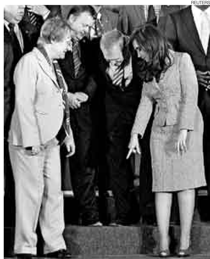
LO SEÑALA. La presidenta de Argentina, Cristina Fernández, sorprendió con su discurso y pidió mejor trato para los inmigrantes.

El mandatario brasileño, Luiz Inacio Lula da Silva, también abordó el tema y pidió a los mandatarios de la Unión Europea que den el ejemplo con medidas concretas.