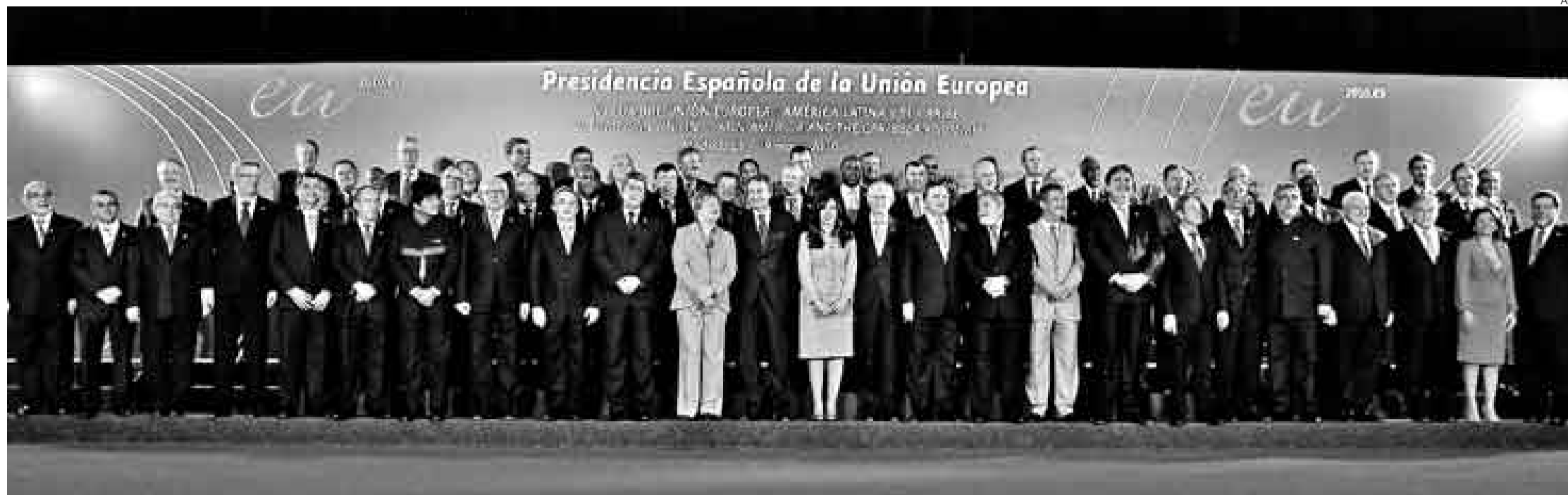
FOTO OFICIAL. Mandatarios y altos representantes participaron en la VI Cumbre de Jefes de Estado y de Gobierno de América Latina y el Caribe y la Unión Europea, realizada en Madrid.

UN MILLÓN 200 MIL PERUANOS VIVEN ACTUALMENTE EN EUROPA