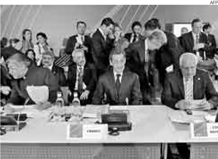
ENCUENTRO. En medio de una severa crisis económica, mandatarios europeos como Nicolas Sarkozy llegaron a la cumbre de Madrid.

Subrayó que lo que se busca es “construir un nuevo mundo para las juventudes de Europa y América, para reordenar positivamente la multipolaridad que existe en este momento en el planeta y construir un espacio que reivindique las viejas banderas que caracterizan a nuestros continentes: la libertad, la igualdad y la fraternidad”.